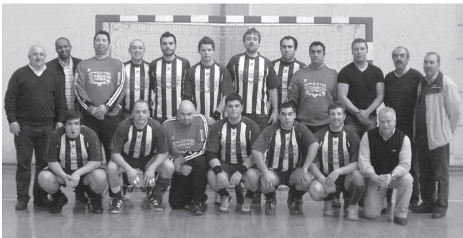
Esta temporada o plantel da ADA é formado à base da prata da casa

Com uma boa dinâmica das duas equipas, jogando num ritmo apreciável, a primeira parte mostrou os argumentos ofensivos da equipa de Castelo Branco, que chegou ao intervalo com uma vantagem (20-12)