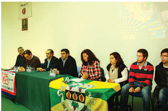
Clube de Andebol conta com uma equipa jovem e multidisciplinar