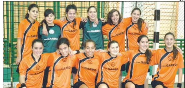
Equipa de iniciadas da Didáxis

Na próxima jornada, dia 12 de Março, as infantis visitam o CA Leça e, no dia 13 de Março, as iniciadas recebem o CD Palmilheira (Ermesinde) às 17h00, em Riba de Ave.