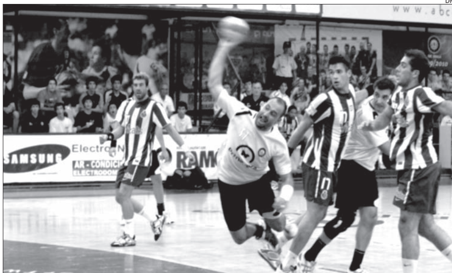
ABC-FC Porto é sempre um jogo apetecível

A abertura oficial do torneio será feita com a realização de um jogo de seniores entre as equipas da ADC Benavente e do Boa Hora FC, amanhã, pelas 21h00.