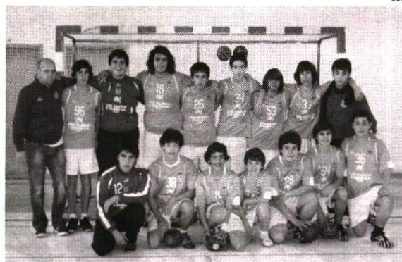
Iniciados Masculinos do Dom Fuas em pose

No campeonato nacional da 1ª divisão de Infantis masculinos na 2ª Fase Zona 1, em jogo a contar para a 2ª jornada o Externato Dom Fuas Roupinho deslocou-se ao reduto do Futebol Clube do Porto onde perdeu 24-17. Na 1ª jornada desta competição a (AEDFR), começou da melhor maneira a sua prestação nesta prova ao derrotar na Nazaré o IPG - GUARDA (30-17). ■