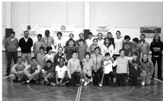
Madeira Andebol SAD fez a delícia de 100 alunos da Escola do C. das Freiras.

Mais uma vez os responsáveis da SAD madeirense ficarão agradados em poder contribuir para a captação de novos atletas para a modalidade, assim como proporcionar um dia diferente aos jovens madeirenses. P. V. L.