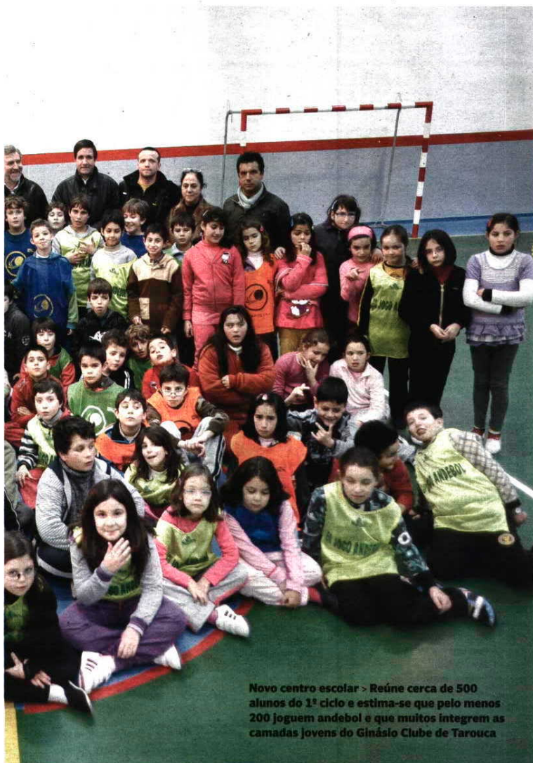
Novo centro escolar > Reúne cerca de 500 alunos do 1º ciclo e estima-se que pelo menos 200 joguem andebol e que muitos integrem as camadas jovens do Ginásio Clube de Tarouca

CEM POR CENTO FORMAÇÃO A partir de hoje, o VI Torneio Internacional de Andebol leva juvenis do FC Porto, Sporting e Benfica até Tarouca