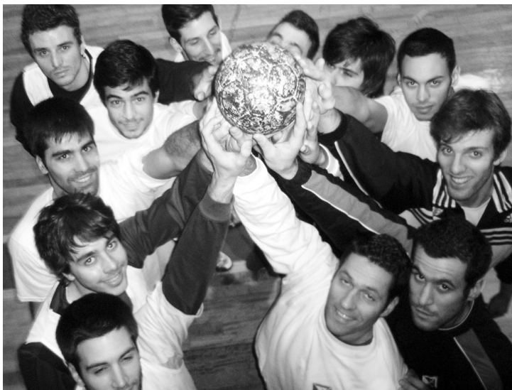
SUBIR O MAIS ALTO possível é o desejo dos jogadores

Os triunfos sobre estas equipas, tidas como mais fortes, são um bom indicador para uma ponta final de época muito boa da formação de Avanca. Composta por jogadores com bastante experiência, tem preparado a fase final com grande concentração para o