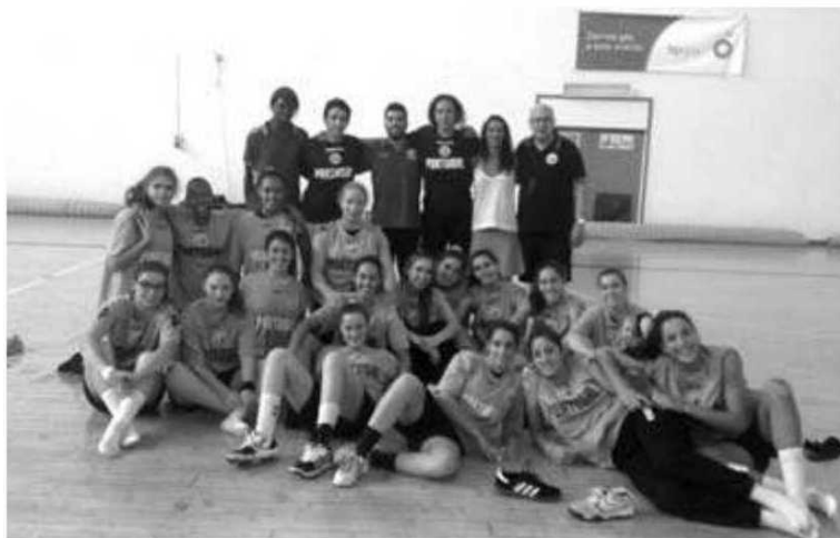
Selecção portuguesa conta com quatro atletas madeirenses.