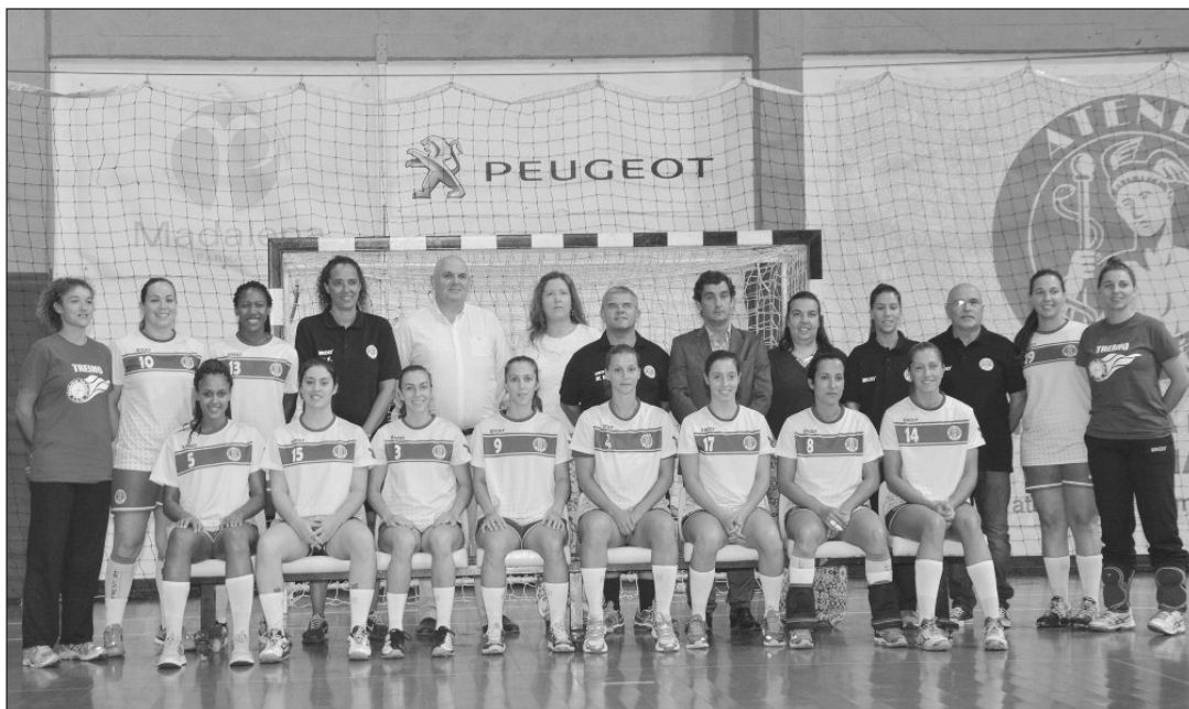
O plantel do Madeira Andebol SAD para época 2015/16. Este domingo, disputa a Supertaça com o Alavarium.