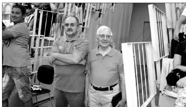
Família Manso fundadores do Andebol Clube de Lamego