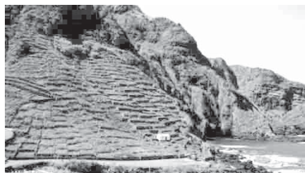
Ilha de Santa Maria está no centro do debate desportivo nos próximos dias

Registe-se, também, a presença de um dos seleccionadores das Selecções Jovens da Federação de Andebol de Portugal, professor