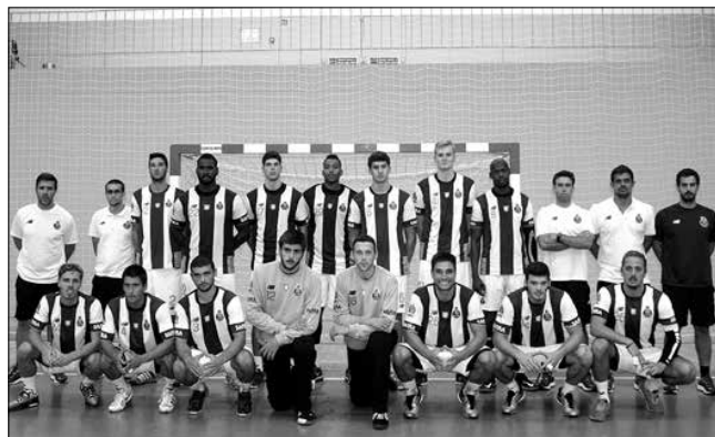
Futebol Clube do Porto

Após o intervalo, a equipa Russa veio decidida a equilibrar o jogo, e com um parcial de 3-0, empatou novamente a partida, nesta fase devido a duas exclusões de 2' consecutivas voltaram a colocar o Porto novamente em vantagem no marcador. Nesta segunda parte ambas as equipas privilegiaram no ataque a circulação de jogadores na 1ª linha, tirando maior vantagem desse fator a equipa russa, devido ao facto do Porto ter alterado o seu sistema defensivo (tornou-o mais aberto – permitiu mais espaço), mas também ao facto da equipa Portuguesa ser composta por muitos jogadores jovens (pagando a fatura da inexperiência a este nível), terminando o encontro com 32-27 para