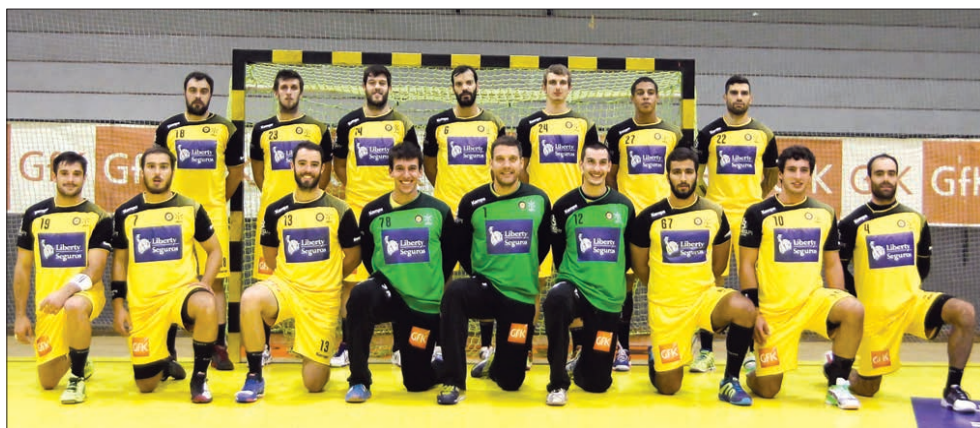
Plantel do ABC para a nova temporada

«O objetivo do ABC é ganhar os jogos todos e conquistar títulos. Penso que temos mais que um reforço, mas também temos os jovens que subiram da nossa formação. Contamos com eles e vão ser os nossos grandes reforços. Fazemos jus ao trabalho da formação», disse o dirigente.