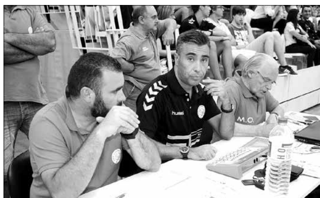
Diretores do Andebol Club de Lamego, no staff da mesa