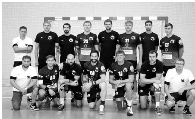
Handball Club Permiskie Medvedi – Russia

Handball Club Permiskie Medvedi 32 Futebol C. do Porto 27