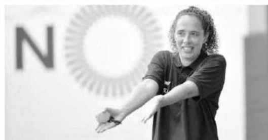
Equipa feminina do Madeira Andebol SAD apresentou-se ontem oficialmente.