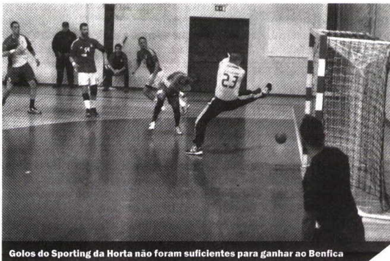
Golos do Sporting da Horta não foram suficientes para ganhar ao Benfica

De referir que depois do jogo de sábado, ficam a faltar apenas três jogos para terminar a 1.ª fase do campeonato de andebol. Assim sendo, depois do Belenenses, o Sporting da Horta irá fora jogar com o Santo Tirso e o Águas Santas e fecha esta fase em casa frente ao ABC a 25 de fevereiro.