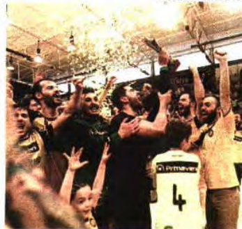
ABC venceu Nacional e Taça Challenge