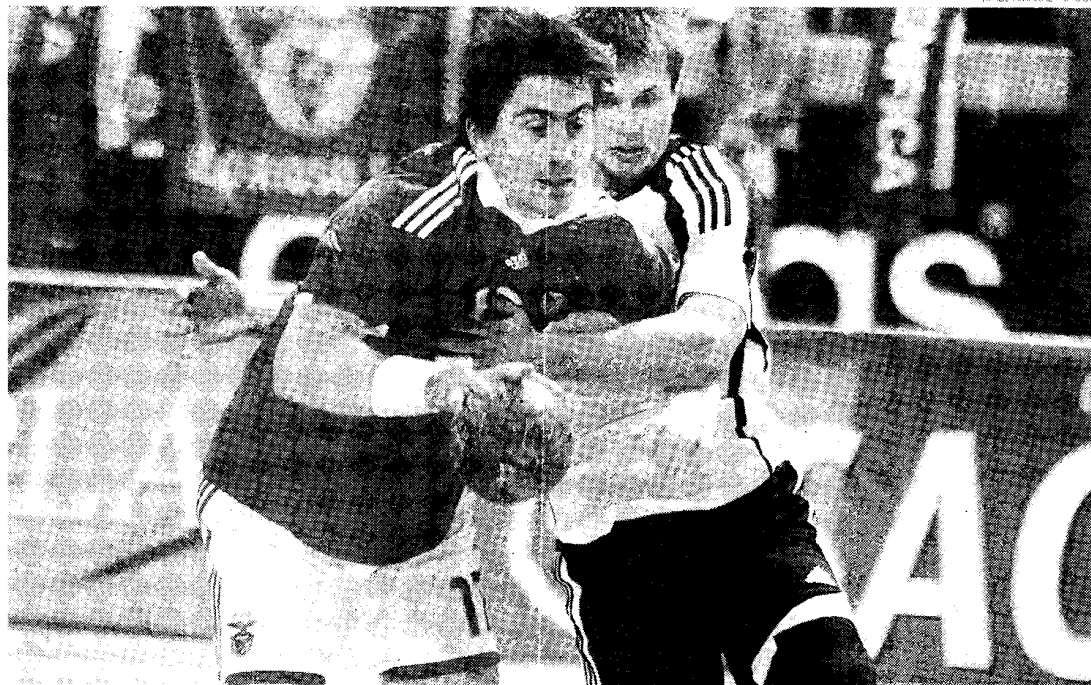
Águias foram sempre mais fortes e estão na quarta eliminatória da Taça EHF