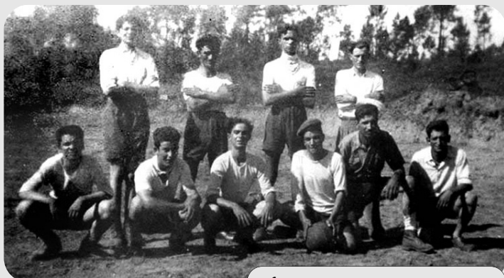
1. Primeira equipa da AD Serpinense (1953)