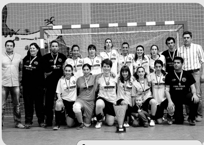
3. Vencedora da Taça AFC - futsal feminino (2011-2012)