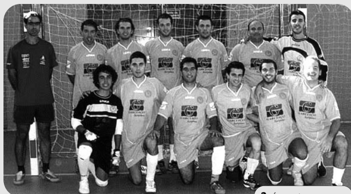
2. Época de 2008-2009