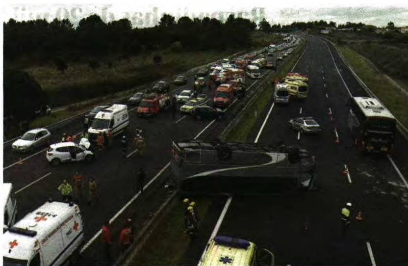
Pesado de passageiros que circulava no sentido sul-norte da A1 galgou o separador central e ficou no sentido oposto

Cartaxo Autocarro com equipa de andebol que ia jogar ao Porto capotou na A1