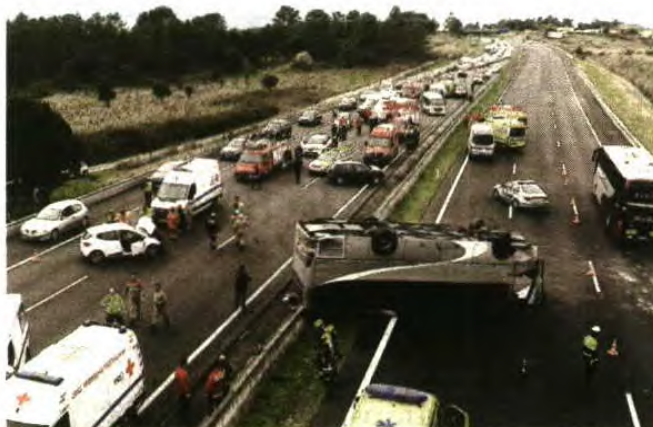
O autocarro capotou sobre o separador e invadiu a via contrária