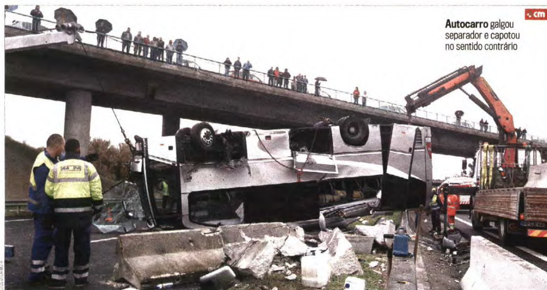
Autocarro galgou separador e capotou no sentido contrário