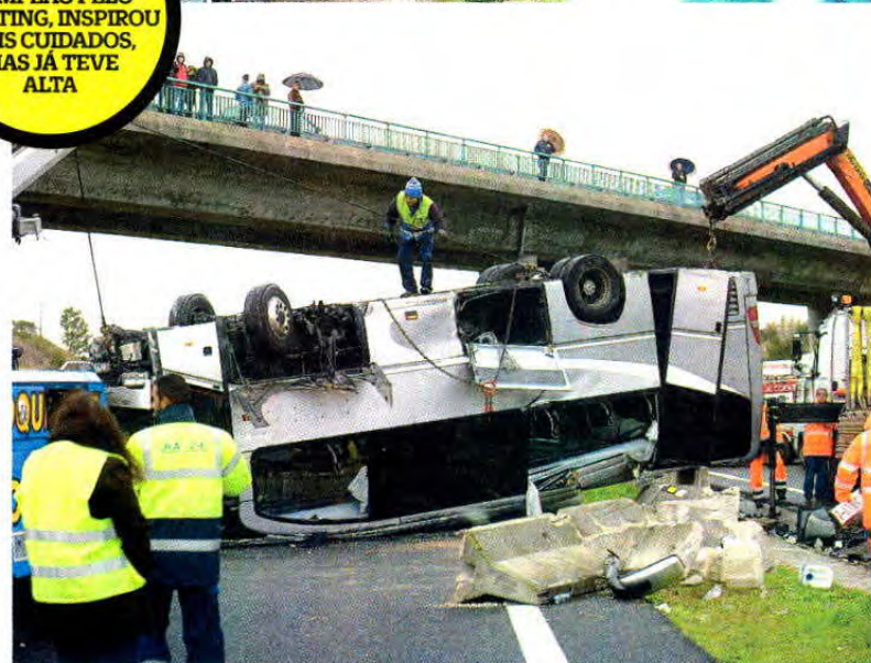
Acidente na A1 envolveu três viaturas, com o autocarro a cair na faixa contrária

o último a levar o Sporting ao título, na época de 2000/01, tendo deixado os leões em 2009 –, mas mesmo ele recebeu alta ao fim da tarde. “Agora é recuperar as mazelas físicas, que felizmente não são de extrema gravidade, e sobretudo superar psicologicamente este traumatizante acontecimento, com a ajuda dos familiares, amigos e da extraordinária segunda família que é o Passos Manuel”, terminou o clube, em comunicado.