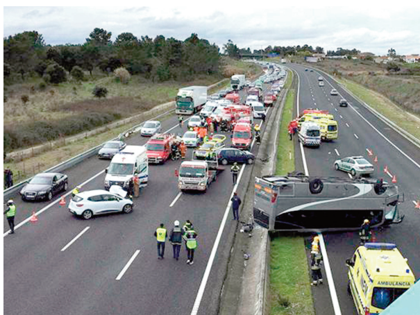
Mais de 20 ambulâncias foram enviadas para o local

O clube de andebol afirmou, ao final da tarde, que a maioria das atletas, dirigentes e treinadores do Passos Manuel envolvidos no capotamento de um autocarro na A1 «já se encontravam em casa» e os que aguardavam alta hospitalar «encontravam-se bem». «Agora é recuperar as mazelas físicas que felizmente não são de extrema gravidade e sobretudo superar psicologicamente este traumatizante acontecimento», lê-se numa informação colo-