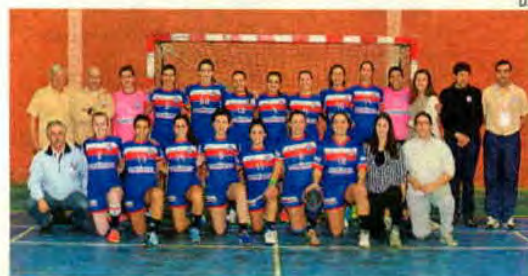
NAAL Passos Manuel é atual 9.º no Nacional da I Divisão feminina