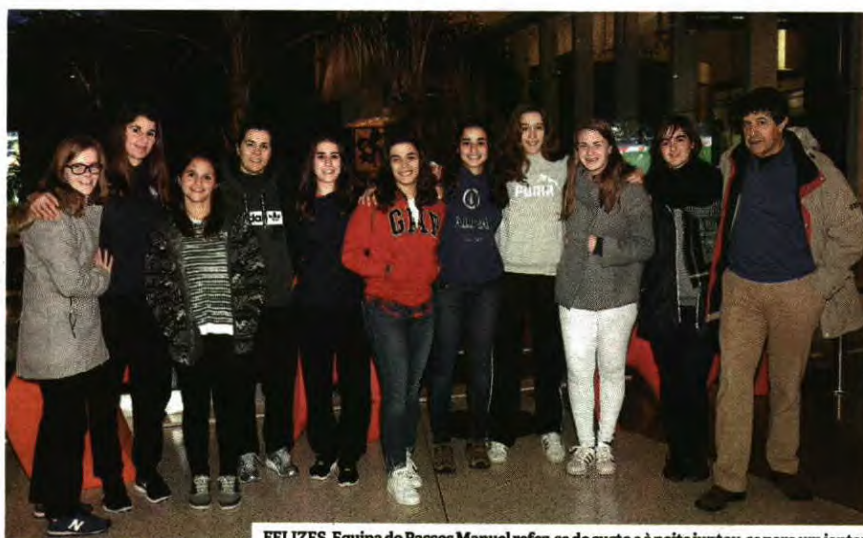
FELIZES. Equipa do Passos Manuel refez-se do susto e à noite juntou-se para um jantar