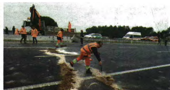
Acidente aconteceu cerca das 11.30 horas e trânsito só voltou ao normal às 15

No local estiveram, ao todo, 116 operacionais, contou Eifel Garcia. Várias corporações de bombeiros dos distritos de Santarém e Lisboa foram mobilizadas para a ocorrência, segundo informações do CDOS de Lisboa, que recebeu o alerta às 11.22 horas. ●