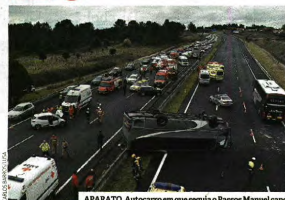
APARATO. Autocarro em que seguia o Passos Manuel capotou, provocando o corte na A1 e o envolvimento de 54 operacionais da Proteção Civil