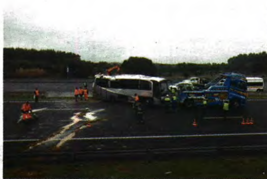
Mais de 100 operacionais foram mobilizados para a ocorrência