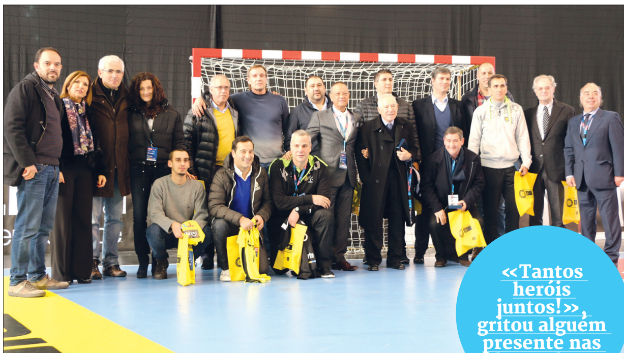
Alguns dos elementos que fizeram parte do "dream team" de 1993/1994

«Tantos heróis juntos!», gritou alguém presente nas bancadas.