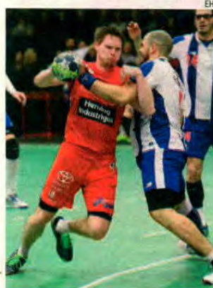
Dragões mostraram-se muito competitivos

Na Alemanha, o Benfica claudicou nas partes iniciais perante o Melsungen: nos primeiros 10 mi-