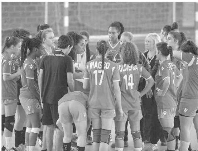
Seleção conta com cinco jogadoras madeirenses.