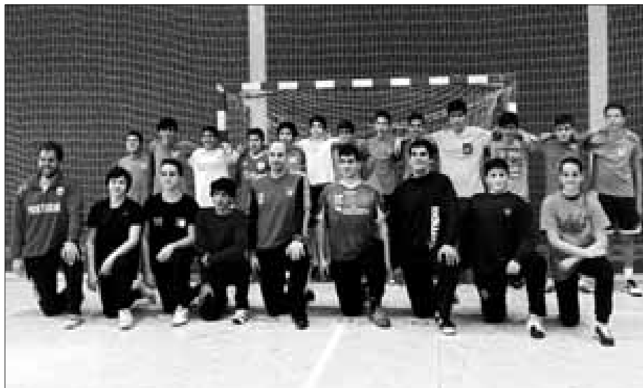
Atual treinador de guarda-redes do Benfica deu "aula" aos atletas de Picassinos

As iniciadas femininas deslocaram-se a Lagos para defrontar o Gil Eanes, jogo que se previa bastante difícil perante as limitações da equipa de Picassinos, resultantes das lesões de várias atletas. Ainda assim,