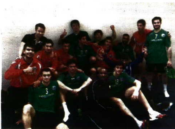
Alegria - Juniores portugueses com vitória animadora

A Seleção Nacional de juniores, que está na Sérvia a disputar o Grupo 8 de apuramento para o Europeu do escalão, venceu a Holanda por 29-27, ocupando o segundo posto num grupo que apura o primeiro classificado, lugar que pertence à Sérvia. "Foi importante entrar a ganhar à quinta equipa do Mundial'13", referiu o selecionador Paulo Fidalgo. Hoje, Portugal defronta a Grã-Bretanha e, amanhã, a Sérvia. O Europeu disputa-se de 24 de julho a 3 de agosto, na Áustria.