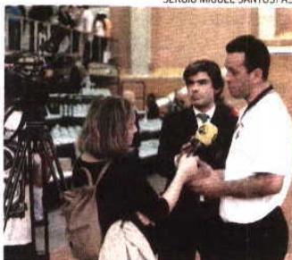
A Bola TV transmite o A. Santos-Sporting