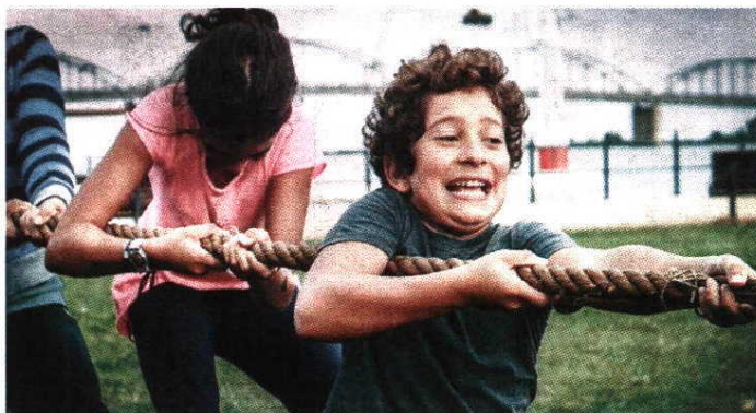
Treinos semimilitares muito divertidos no bootcamp

O Jardim Zoológico de Lisboa oferece umas férias selvagens para as crianças dos 6 aos 16 anos. O ATL da Páscoa e os ateliers de férias conduzem os mais novos numa viagem pela aventura, que tem o mundo mágico do zoo como pano de fundo. Uma oportunidade para o seu filho aprender mais sobre a natureza e as diferentes espécies que ali habitam. Além disso, vai poder interagir de perto com algumas das espécies mais emblemáticas do zoológico. O ATL e os ateliers estão organizados por dias temáticos.