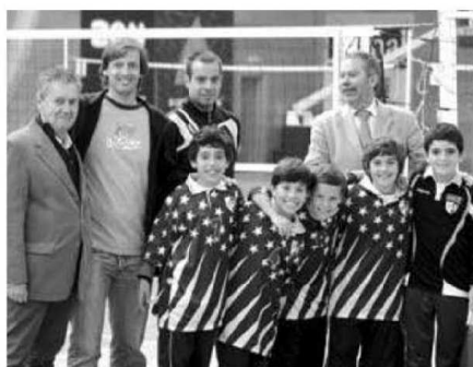
Voleibol e andebol estiveram juntos na actividade.