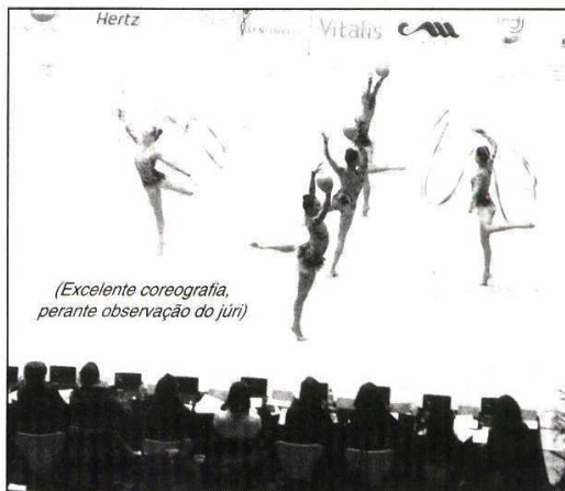
(Excelente coreografia, perante observação do júri)