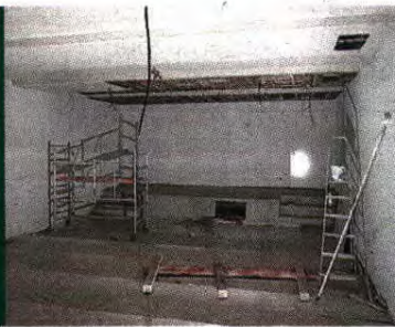
LOTAÇÃO. A sala de conferências terá capacidade para 50 lugares, tantos como os destinados à imprensa escrita na bancada. O pavilhão poderá albergar três mil espectadores com bilhete