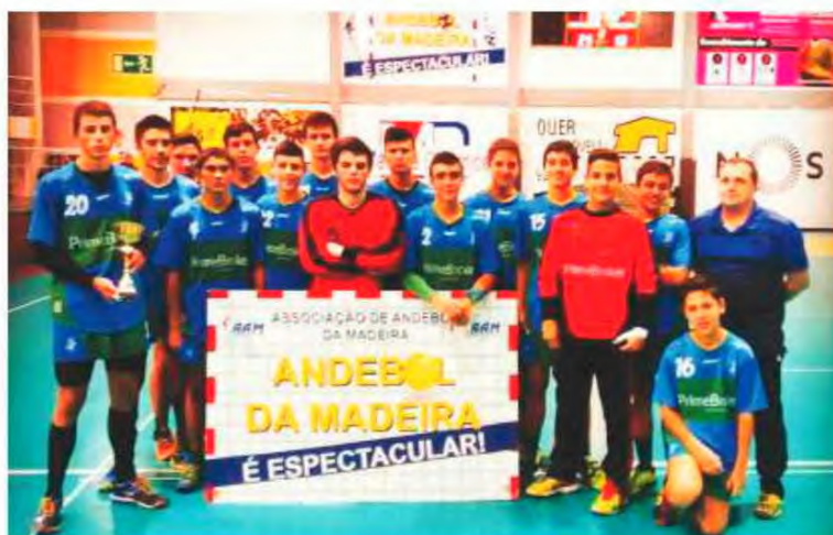
Equipa de iniciados está a competir em Santa Maria da Feira.