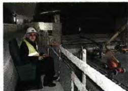
Sporting, existirão lugares VIP na bancada superior, "a vista mais bonita".

LUGARES O camarote presidencial terá 60 lugares. A dimensão das cadeiras já começou a ser testada. No topo Sul, onde vão ficar as claques do