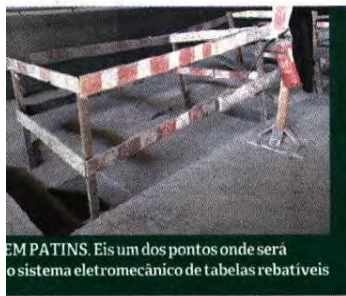
EM PATINS. Eis um dos pontos onde será o sistema eletromecânico de tabelas rebatíveis