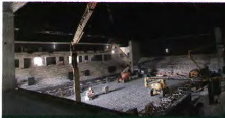
RECINTO. No interior, faltam colocar tetos falsos, iluminação (LED), cadeiras (verdes) e o piso (em acer)