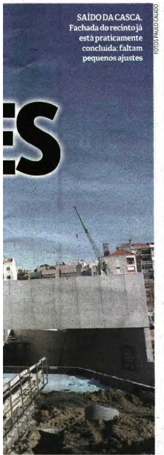
SAÍDO DA CASCA. Fachada do recinto já está praticamente concluída: faltam pequenos ajustes