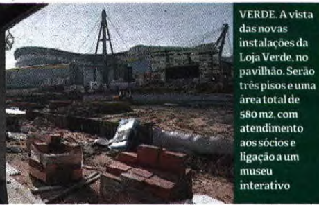
VERDE. A vista das novas instalações da Loja Verde, no pavilhão. Serão três pisos e uma área total de 580 m2, com atendimento aos sócios e ligação a um museu interativo