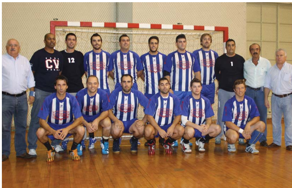
Albicastrense é a equipa que mais quilómetros percorre

O presidente da Albicastrense já esteve mais confiante em relação à continuidade do andebol, que é uma modalidade que, diga-se, continua a ter uma boa franja de adeptos em Castelo Branco. Ainda no último sábado, no encontro da equipa sénior com o Ílhavo (24-25) a bancada principal do Municipal esta-