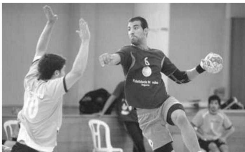
Madeirense do Madeira SAD participa no Bring Vup 2011.