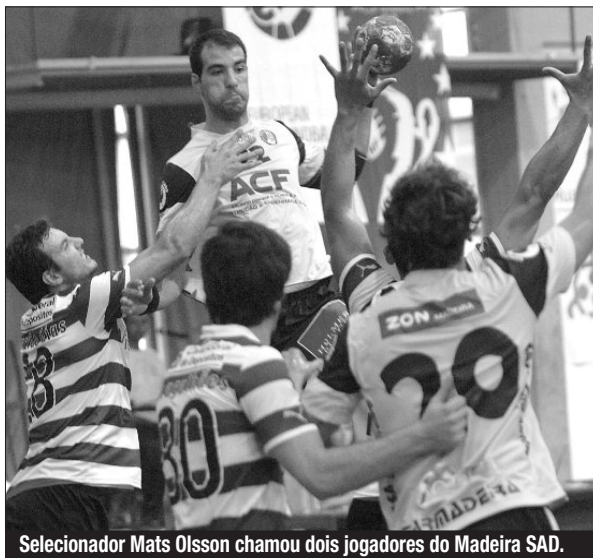
Seleccionador Mats Olsson chamou dois jogadores do Madeira SAD.

A presença no torneio insere-se no plano de preparação de Portugal para a fase de qualificação para o Mundial de 2013 e Portugal vai encontrar duas equipas apuradas