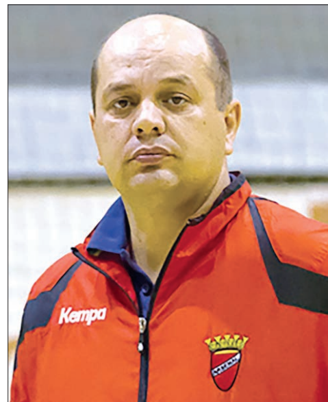
Técnico sem mágoa mas esperava... um agradecimento

«Quando era atleta, sempre achei que era mais complicado jogar na II Divisão do que na I. As pessoas podem es-