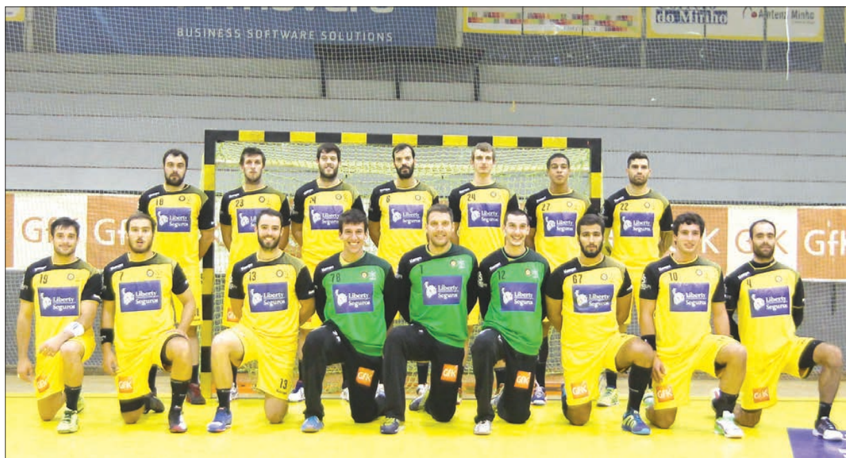
ABC/UMinho está com bom início de temporada

Sortes diferentes tiveram as equipas minhotas no arranque do campeonato nacional de andebol da I Divisão. O ABC/UMinho deslocou-se ao Pavilhão Acácio Rosa, em Belém, e venceu o Belenenses, por 33-24, dando assim o melhor seguimento à conquista da Supertaça na semana passada frente ao FC Porto.