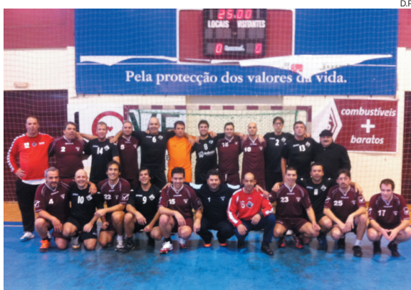
Veteranos do S. Bernardo venceram em casa

Em termos desportivos, o S. Bernardo foi o grande vencedor; ao bater na final, disputada já da parte da tarde, o Porto “Vintage”, por 27-22, numa partida equilibrada em que a equipa de veteranos aveirense justificou a vitória já nos derradeiros minutos.