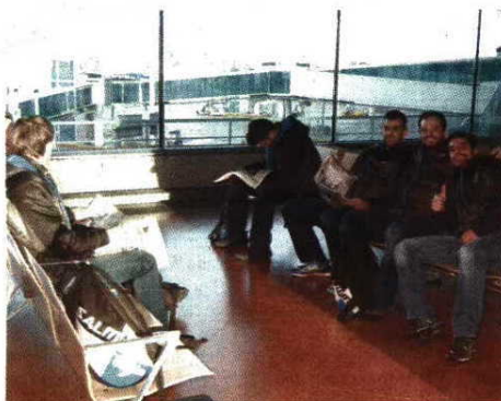
Novidade - Águas nunca fez cinco jogos em três dias