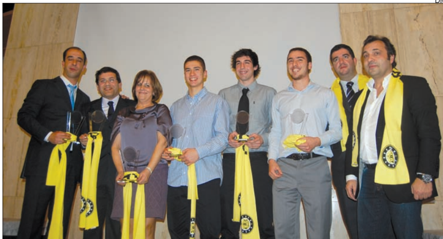
Os premiados na última gala do ABC