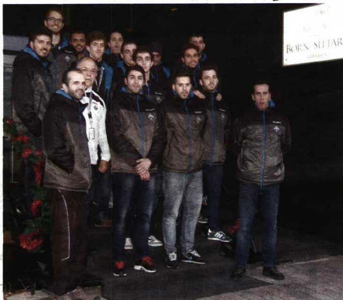
Animados - Equipa do Águas Santas à entrada do seu hotel em Sittard

Apesar da quase obrigatoriedade de dar tempo de jogo a todos os atletas que integram a comitiva - "Não tem lógica trazer 16 jogadores e deixar permanentemente três ou quatro de fora", admi-