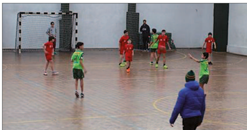
A equipa de infantis masculinos disputou o Torneio de Carnaval com a Juve Lis

Nos escalões femininos verificaram-se três jogos que terminaram com três derrotas. As seniores perderam por 19-26 em casa, na recepção ao Vela Tavira, que se mostrou sempre mais experiente e objetivo que a equipa local. A formação júnior, por sua vez, deslocou-se ao reduto da Juve Lis, onde