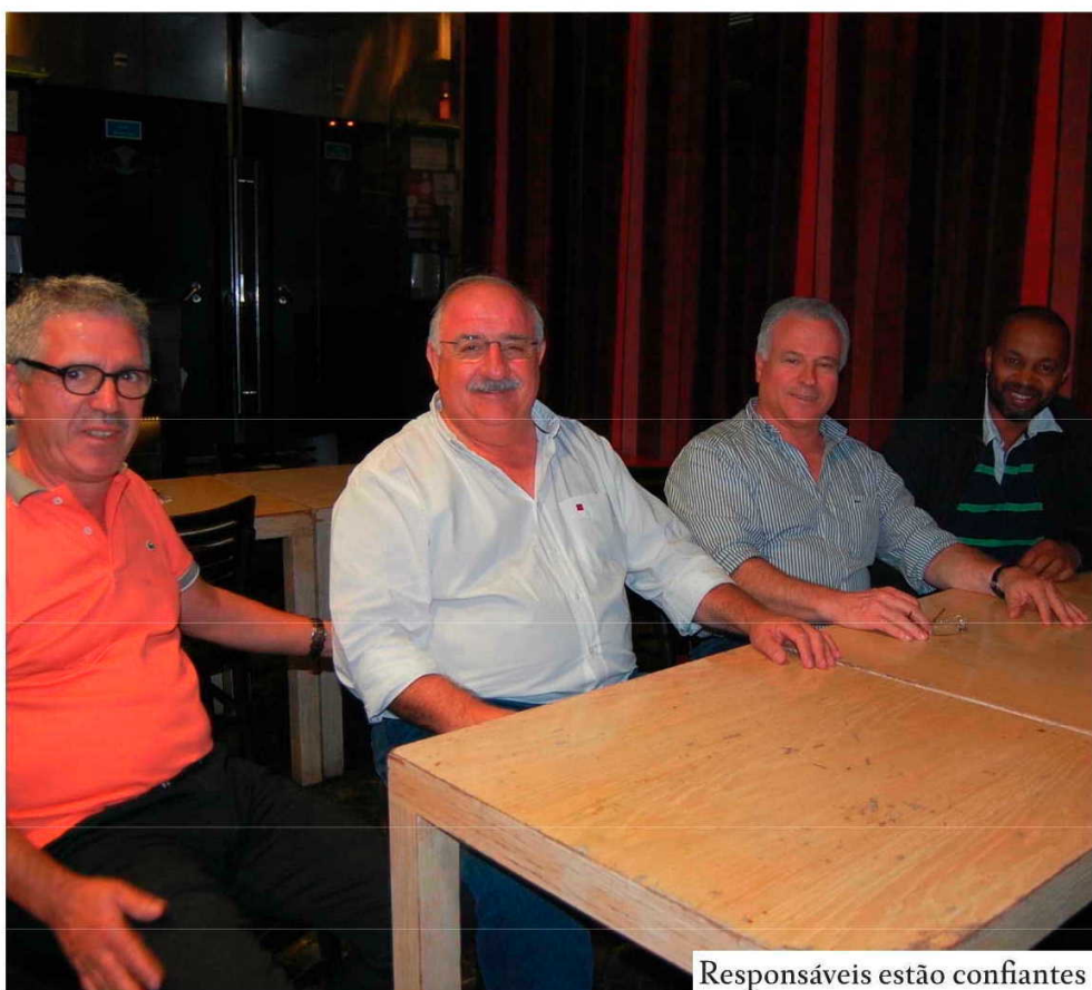
Responsáveis estão confiantes

"Estamos a conseguir formar um plantel mais homogêneo", sublinha o presidente da ADA. Mata adianta ain-