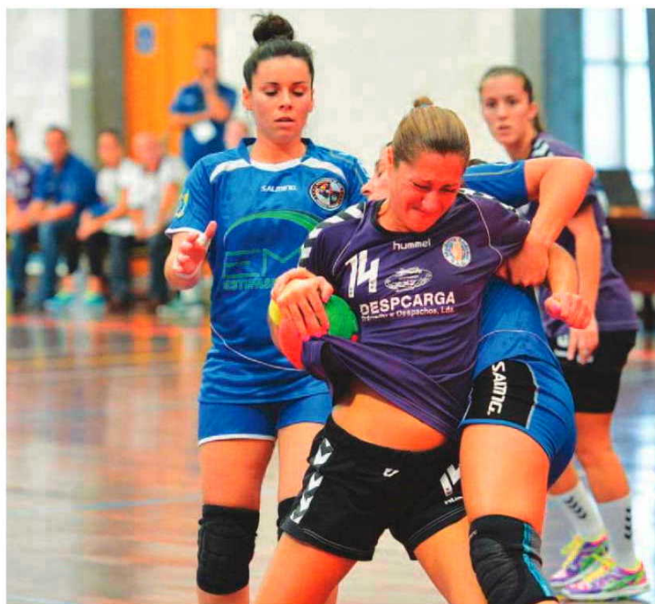
Madeirenses defrontam amanhã adversário de peso.