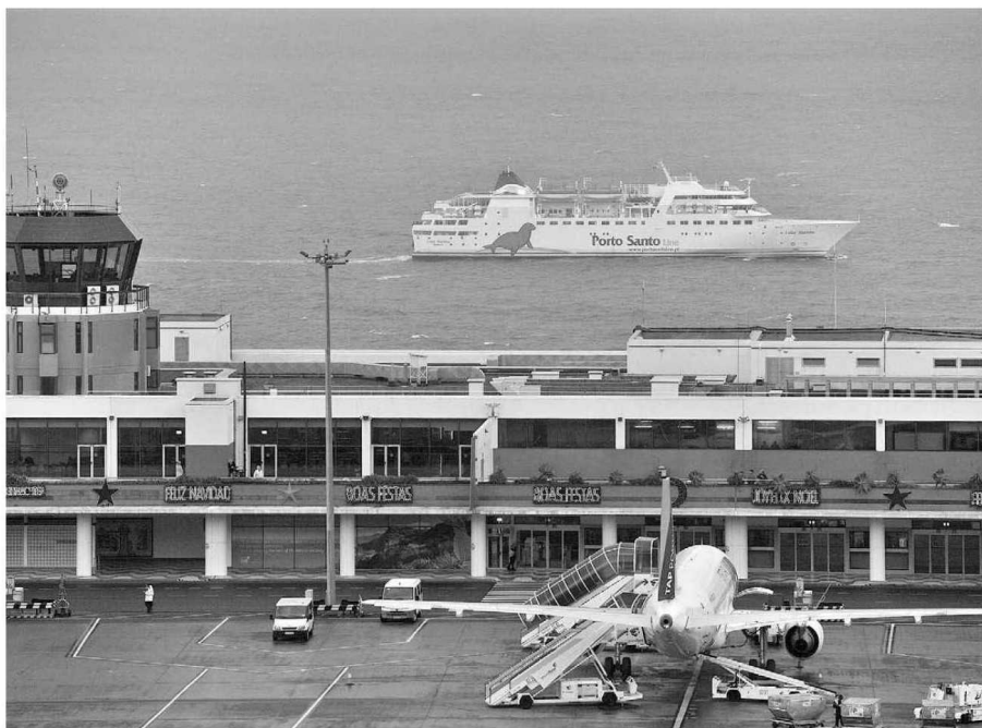
Só em deslocações (aéreas e marítimas) o PRAD contempla mais de 1,8 milhões de euros.

Portanto, os apoios já estão definidos no papel, falta agora a parte