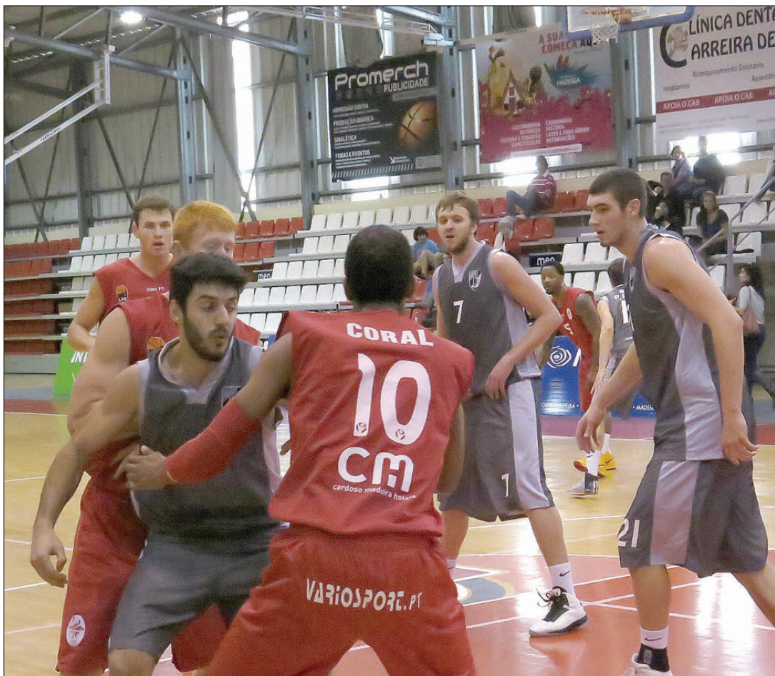
O Clube Amigos do Basquete paga 15.000 euros pela totalidade das ações, ao preço de 50 cêntimos cada.

AS ALIENAÇÕES DAS PARTICIPAÇÕES QUE O GOVERNO REGIONAL DETINHA EM TRÊS SOCIEDADES ANÓNIMAS DESPORTIVAS ESTAVAM PREVISTAS NO PLANO DE PRIVATIZAÇÕES E REESTRUTURAÇÕES DO SETOR EMPRESARIAL DA REGIÃO AUTÓNOMA DA MADEIRA, QUE POTENCIAM "A LIBERTAÇÃO DE RECEITAS QUE POSSAM SER APLICADAS NA REDUÇÃO DA DÍVIDA E DO DÉFICE PÚBLICO REGIONAL E NO REFORÇO DOS INVESTIMENTOS PÚBLICOS ESTRATÉGICOS E NUCLEARES PARA A REGIÃO".