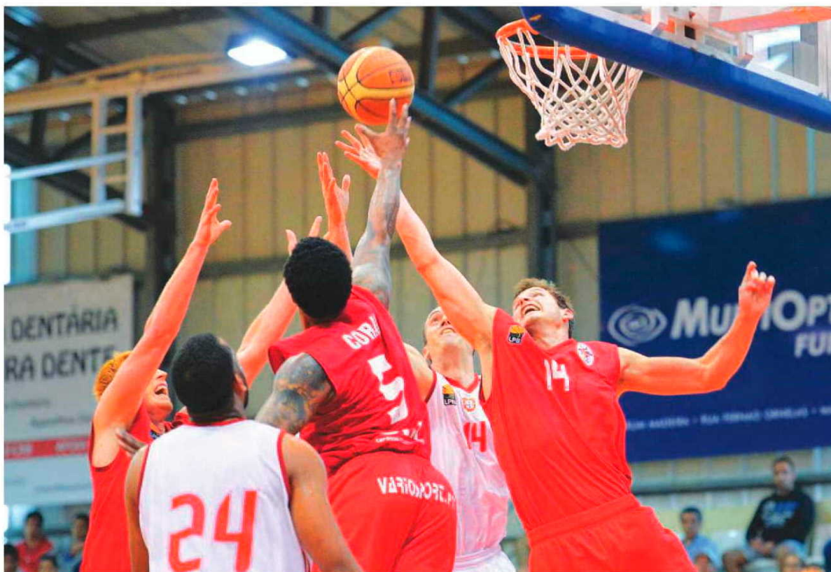
CAB vai comprar a parte do Governo na SAD pagando 15 mil euros,