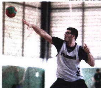
Portugueses recebem os russos amanhã