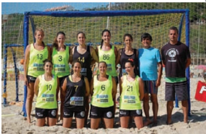
100 ondas dominam competições nacionais