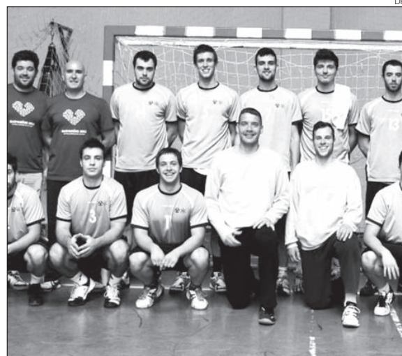
Andebol quer terminar EUSA Games no pódio