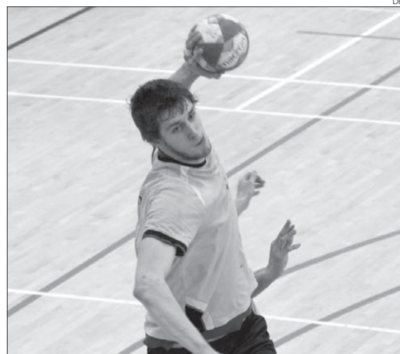
Andebol quer terminar EUSA Games no pódio

O encontro deu ainda para que o técnico Gabriel Oliveira colocasse mais tempo em jogo os atletas menos utilizados e assim fizesse descansar os mais utilizados, já a pensar no próximo confronto contra a Universidade de Paris (que no último dia se reforçou com quatro atletas oriundos da sua seleção de sub. 20) que vai decidir o 3.º e 4.º lugar e quem ficará com a medalha de bronze.