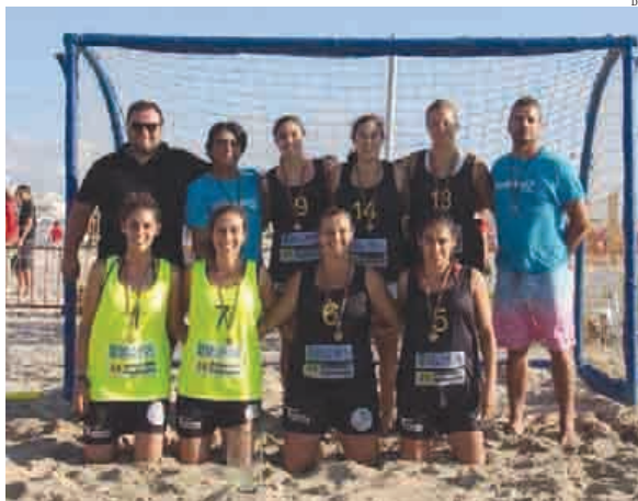
100 ondas venceram todos os jogos que disputaram