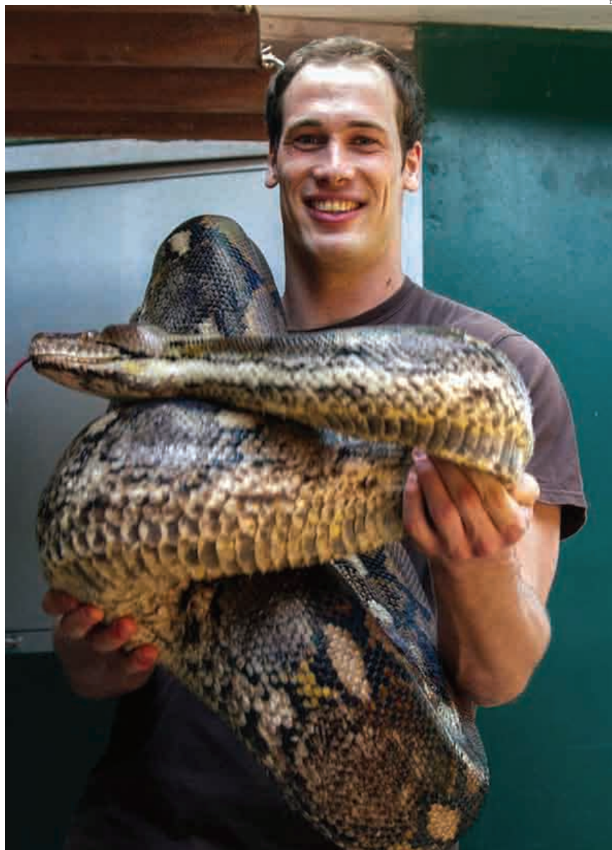
Amor por animais vem do tempo de criança

Pensou, pensou, pensou. Resolveu colocar as várias possibilidades em cima da balança e achou que era hora de deixar para trás o andebol e seguir com aquilo que sempre se viu a fazer: viver para os animais. “No andebol, os meus amigos sabem que o andebol não é a minha paixão. Por isso, resolveu cortar radicalmente com o desporto de alta competição, porque o surf e as futeboladas com amigos vão estar sempre presentes. “Tinha de ser já. Faltam-me 4 anos para acabar o curso e não quero atrasar-me mais. Noutros tempos preferi o desporto à faculdade, agora já