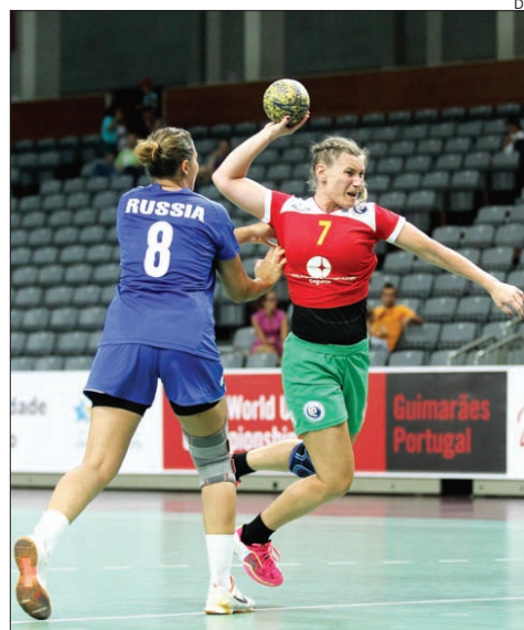
Um ataque da seleção portuguesa

Hoje é dia de descanso no campeonato, que recomeça amanhã com a luta pelos lugares nas meias-finais.