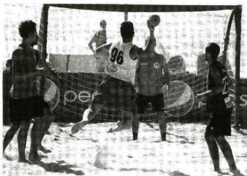
(Masters) e Arsenal Canelas (Rookies).

Na prova exemplarmente organizada pela Associação Académica de Espinho (secção de andebol), a equipa da EFE 'Os Tigres' ganhou, também, em Rookies masculinos. No escalão feminino, a vitória foi para a equipa N8N80/Cavalinho