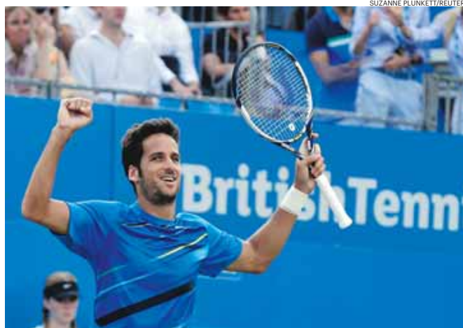
Feliciano López festeja triunfo sobre Berdych