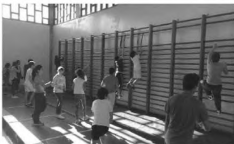
Escalada teve uma acção de formação.

Esta iniciativa teve como objectivos abordar técnicas específicas da escalada, como a colocação dos pés e das mãos nas presas, exercícios de progressão das técnicas, e estratégias para superar as dificuldades da modalidade.