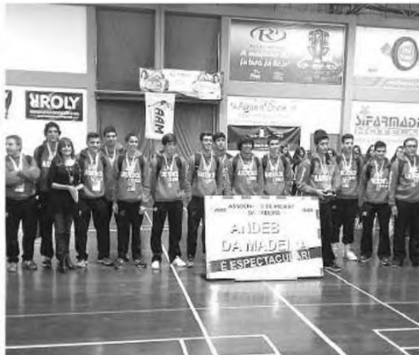
Andebol madeirense promoveu mais um torneio de formação a nível de selecções regionais.