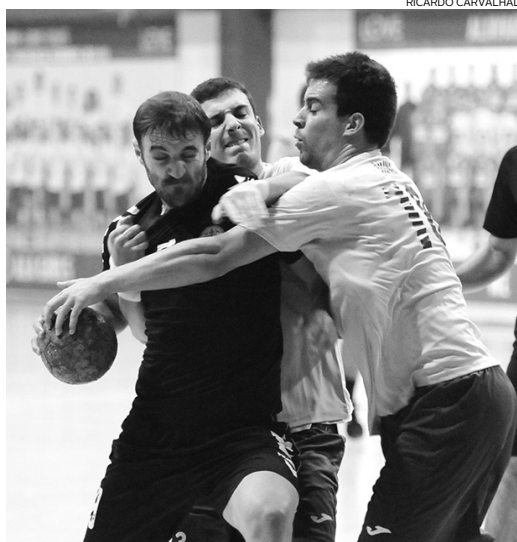
Alavarium não conseguiu travar a maior experiência “auri-negra”

permitiu ao Beira-Mar chegar ao intervalo na frente do marcador, sem apelo, nem agravo, e já com sinais claros de que o Alavarium sentiria muita dificuldade para fazer frente a uma