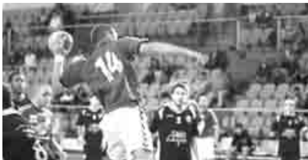
Equipa da Torre da Marinha anseia por voos mais altos

O Torrense recebeu e venceu o Núcleo de Andebol do Redondo, por 30-18, em jogo realizado no pavilhão da Torre da Marinha a contar para a 19.ª jornada do Campeonato Nacional da 3.ª Divisão. Com o triunfo obtido, a equipa do concelho do Seixal manteve o terceiro lugar da tabela classificativa com menos dois pontos que o Boa Hora (que se encontra em segundo lugar) e menos sete que o Zona Azul, que lidera a competição. Mas, a sua posição em nada satisfaz as suas pretensões, que passavam pelo apuramento para a segunda