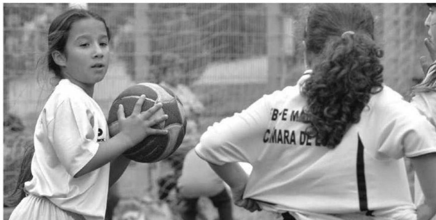
Basquetebol de Câmara de Lobos jogou-se na Choupana.