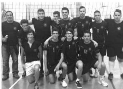
Alunos de Caneças vieram jogar voleibol à Madeira. FOTOS DSDE