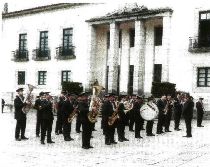
O programa comemorativo teve início nos Paços do Concelho