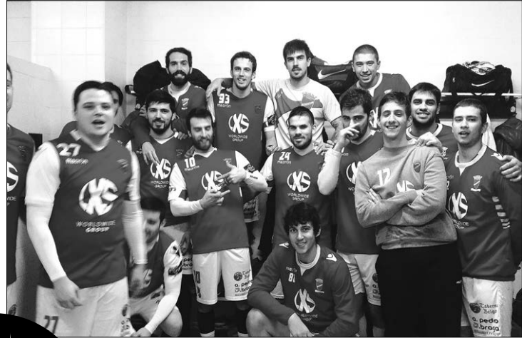
Campeão ABC e estreante Arsenal da Devesa começam campeonato em casa