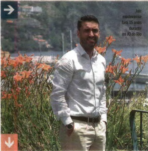
Juiz madeirense fará 35 anos durante os JO do Rio