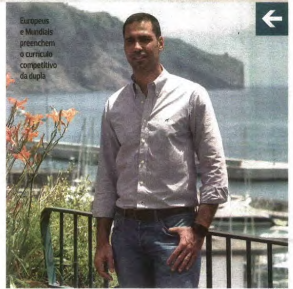
Europeus e Mundiais preenchem o currículo competitivo da dupla