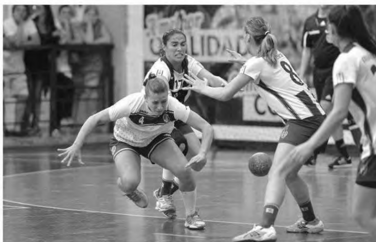
Femininos abrem a época com a realização da Supertaça.

Na segunda ronda, dia 10 de Setembro, os madeirenses actuam no Pavilhão do Benfica, recebendo na terceira ronda no Funchal o Avanca. O 'nacional' da I Divisão em masculinos será disputado por 14 clubes sendo apurando para a fase final os seis primeiros classificados. H. D. P.