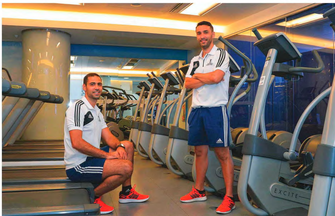
Árbitros madeirenses preparam-se para viver uma experiência ao mais alto nível nos Jogos Olímpicos do Rio de Janeiro.