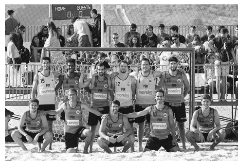
Os Vakedo Gaw conquistaram o título pela terceira vez

Refira-se que, com estas vitórias, as equipas de Masters apuraram-se para a Liga dos Campeões, que se disputa, em Novembro, em Gran Canária, na Espanha. ◀