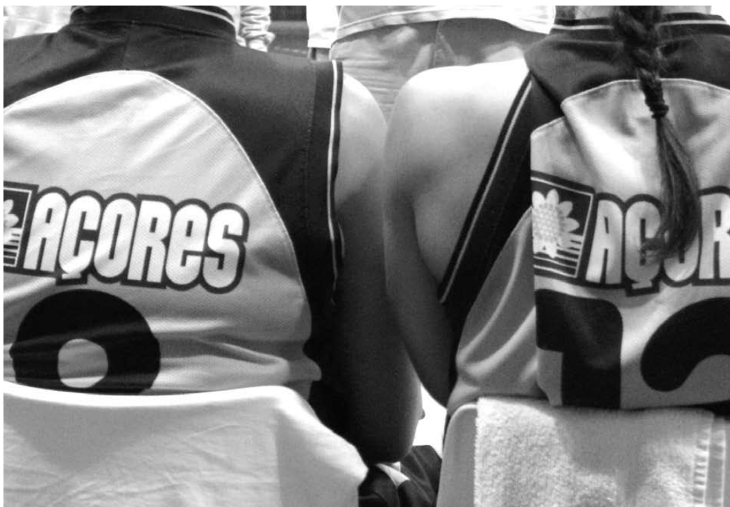
ILHA TERCEIRA tem seis equipas contempladas com o apoio da palavra Açores