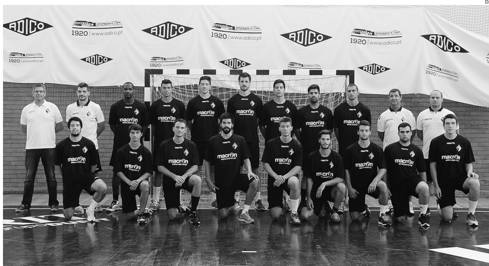
Plantel da Artística de Avanca que já começou a preparar a temporada 2016/2017

O sistema competitivo do campeonato desta época será diferente. Não haverá “play-off”