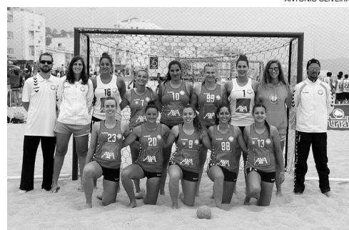
As 2Much4You sagraram-se campeãs pela primeira vez