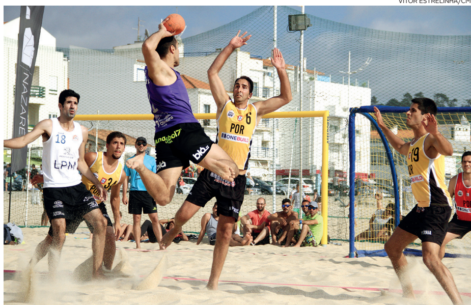
A equipa aveirense Vakedo Gaw, que representou Portugal na EBT, entram hoje em acção