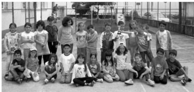
Escola do Caminho Chão, campeão do 1.º e 2.º ano de andebol.

As 13 concentrações decorreram nas escolas da Sede, São Jorge e Pavilhão de Santana durante os últimos 2 meses, envolvendo mais de