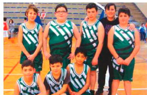
Basquetebolistas de Santana.