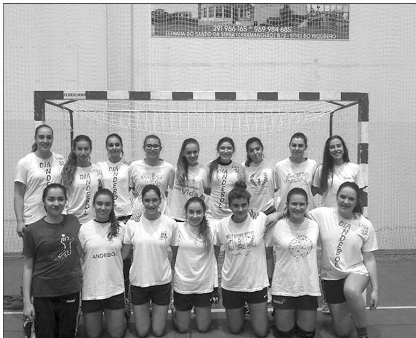
Seleção de juvenis femininos que represeta a Madeira no Torneio da Associação.

No domingo, fecha a competição com a derradeira ronda, defrontando-se às 15h30 AA Porto e AA Lisboa, com o confronto entre as duas equipas madeirenses (CS Madeira e AA Madeira), às 17h30, a encerrar o torneio. Depois, pelas 19h30 realiza-se a cerimónia de entrega de prémios, seguindo-se, no