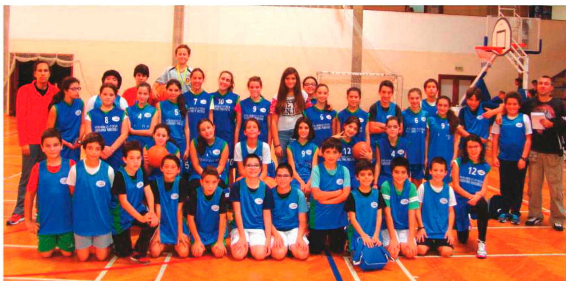
Basquetebolistas infantis da Bartolomeu Perestrelo.

No pavilhão da Escola Francisco Franco aconteceu a III Concentração de basquetebol para infantes da zona Funchal/Este, enquanto no Pavilhão da Levada realizou-se a II Concentração de Iniciados Masculinos da Zona Fun-