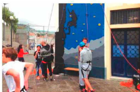
Escalada teve actividade.