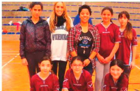
Basquetebolistas de São Jorge.