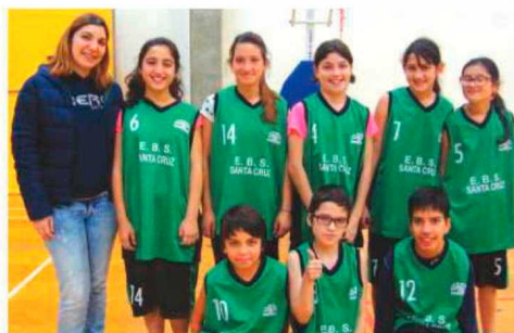
Representação de basquetebol da Santa Cruz.