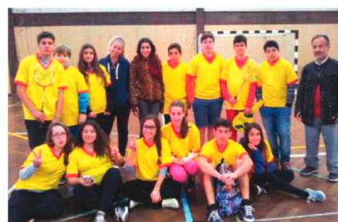
Representação do Caniçal em badminton.