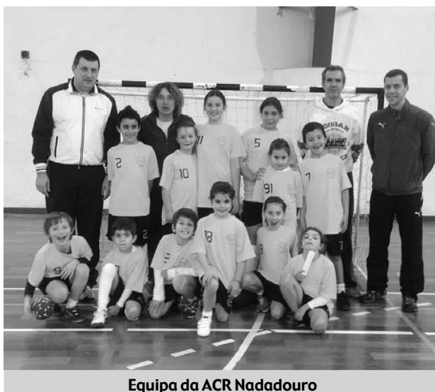
Equipa da ACR Nadadouro

Participou com duas equipas (eram vários jogos e atividades para equipas de cinco) e no final todos estavam satisfeitos por uma tarde de convívio cheio de andebol.