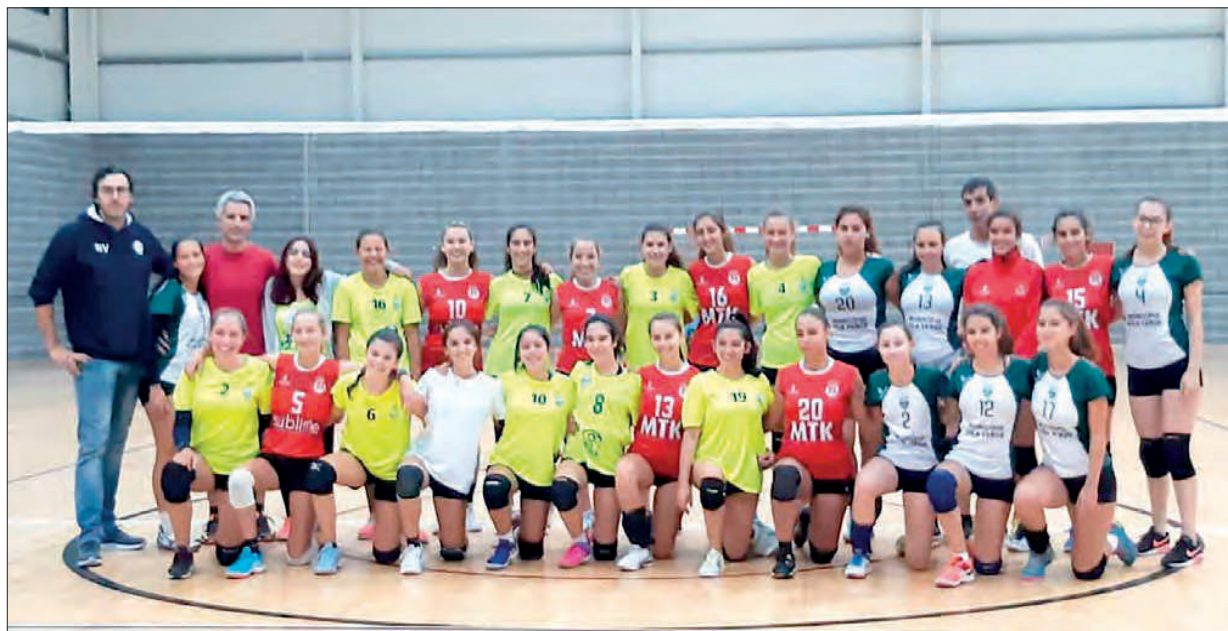
Equipas de Vila Verde e Esposende que participaram no jogo de apresentação

O Vila Verde Atlético Clube apresentou, no passado fim de semana, no Pavilhão Municipal do Vade, as equipas femininas de iniciadas e juvenis em andebol.