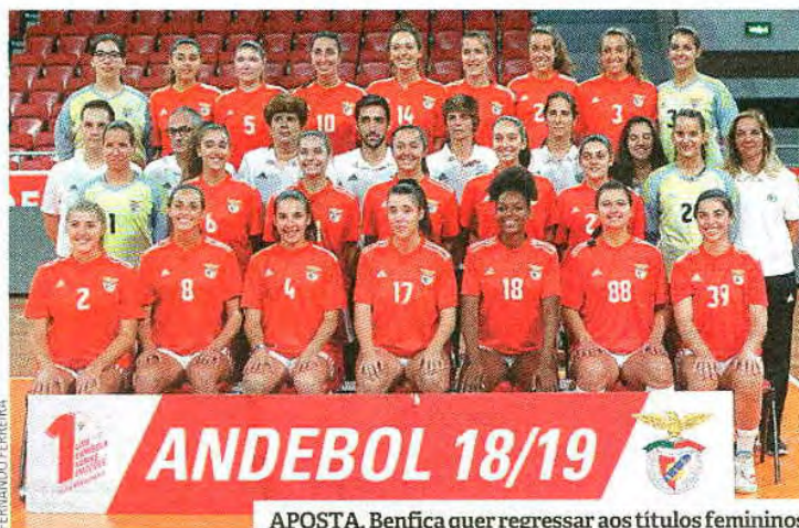
APOSTA. Benfica quer regressar aos títulos femininos