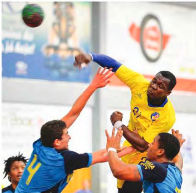
Madeira Andebol SAD não facilitou frente ao Maia.

Sem nunca ter estado em causa quer a qualidade do andebol praticado pelo Madeira SAD, esta foi no entanto uma partida bem disputada sobretudo durante os primeiros trinta minutos. A equipa da Maia, marcou 31 golos ainda assim, revelou dispor de um conjunto de andebolistas de qualidade, sempre inconformados com o resultado e lutando sempre por minimizar a vantagem clara da equipa da casa. Por isso mesmo os madeirenses foram obrigado a uma constante atenção na sua organização o que resultou num jogo com ritmo relativamente bem disputado e sobretudo realista com números acentuados mas justo para o lado da formação da Madeira. Os madeirenses alinharam com Yus-