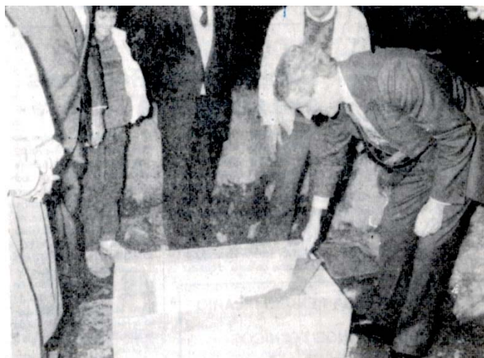
Mota Amaral no lançamento da primeira pedra em 1988

A intenção da construção do Complexo Desportivo das Laranjeiras surgiu no período de governação de Mota Amaral.