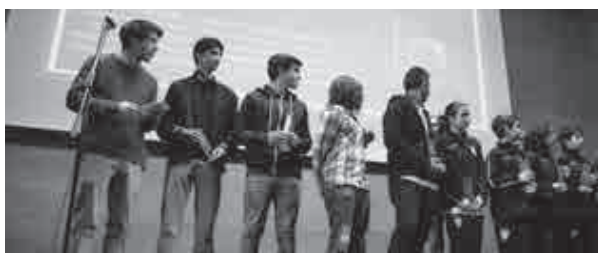
Atletas da secção de Andebol premiados