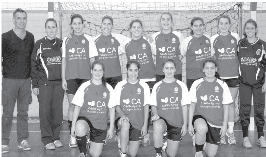
▲ Seniores femininos do Valonguense