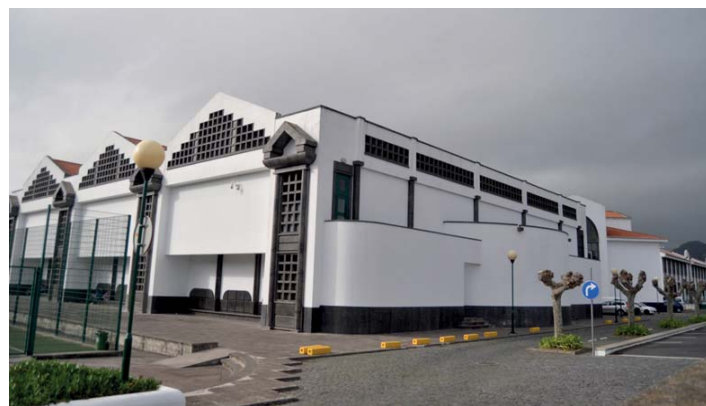
Aspecto dos pavilhões do Complexo Desportivo das Laranjeiras