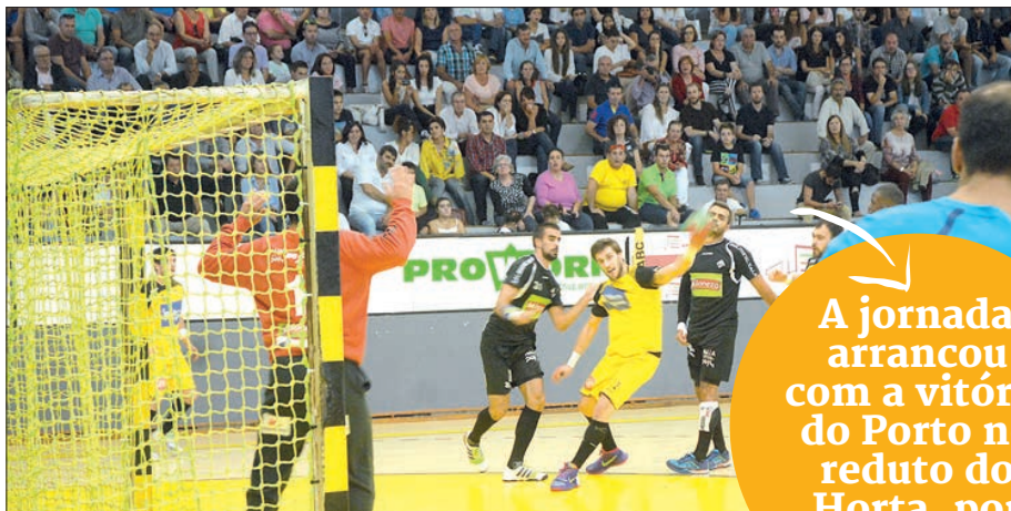
Na primeira volta, maiatos venceram no Sá Leite