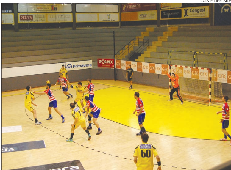
ABC conseguiu finalmente vencer um jogo da fase final