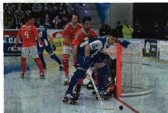
Equilíbrio - Jogos entre FC Porto e Benfica têm sido muito disputados