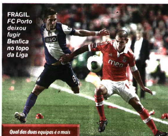
FRAGIL. FC Porto deixou fugir Benfica no topo da Liga

Leitores. A votação que decorreu em www.record.pt tem resultados ainda mais acentuados a respeito da posição privilegiada que o Benfica ocupa para chegar ao título. São 83,1 por cento a dizer que as águias têm maiores possibilidades, ao passo que os dragões reúnem apenas 14,7 por cento das preferências. O grau de incerteza expresso em "nenhuma" e "não sabe/não responde" é residual.