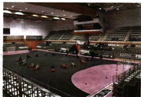
Apolo > Pavilhão Municipal de Santo Tirso vai encher