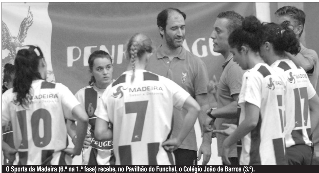
O Sports da Madeira (6.º na 1.ª fase) recebe, no Pavilhão do Funchal, o Colégio João de Barros (3.º).