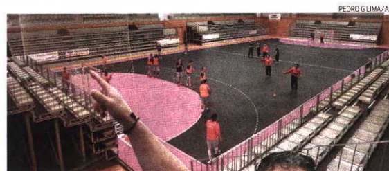
PEDRO G. LIMA/ASF

São esperadas cerca de 2500 pessoas no pavilhão municipal, em Santo Tirso