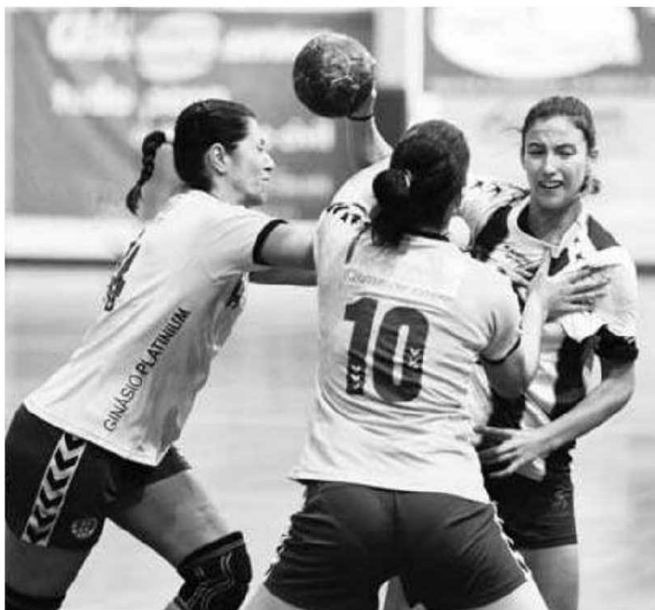
SAD feminina e Sports Madeira estão na luta pelo título.