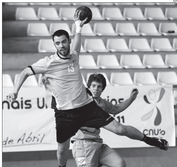
Andebol da UM parte com ambições para a fase final

No caso destas três equipas, apenas o basquetebol se apresenta com uma tarefa mais complicada para a renovação do título, dado o equilíbrio existente entre os conjuntos da AAU-Minho, AAUAveiro, Académica e AAUBI, já no andebol e futsal tudo aponta para mais um “final