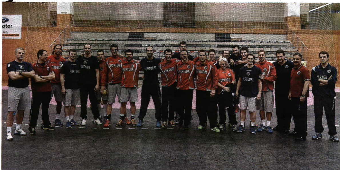
Preparados - Seleção Nacional regressou ontem ao trabalho com grande motivação e objetivos inalterados

dade, mas depois recuperámos, fizemos um parcial de 5-0 e dominámos o jogo completamente, sempre com três quatro bolas de vantagem. São fatores do jogo. Mas fomos melhor equipa do que eles e merecíamos mais a vitória do que eles o empate".