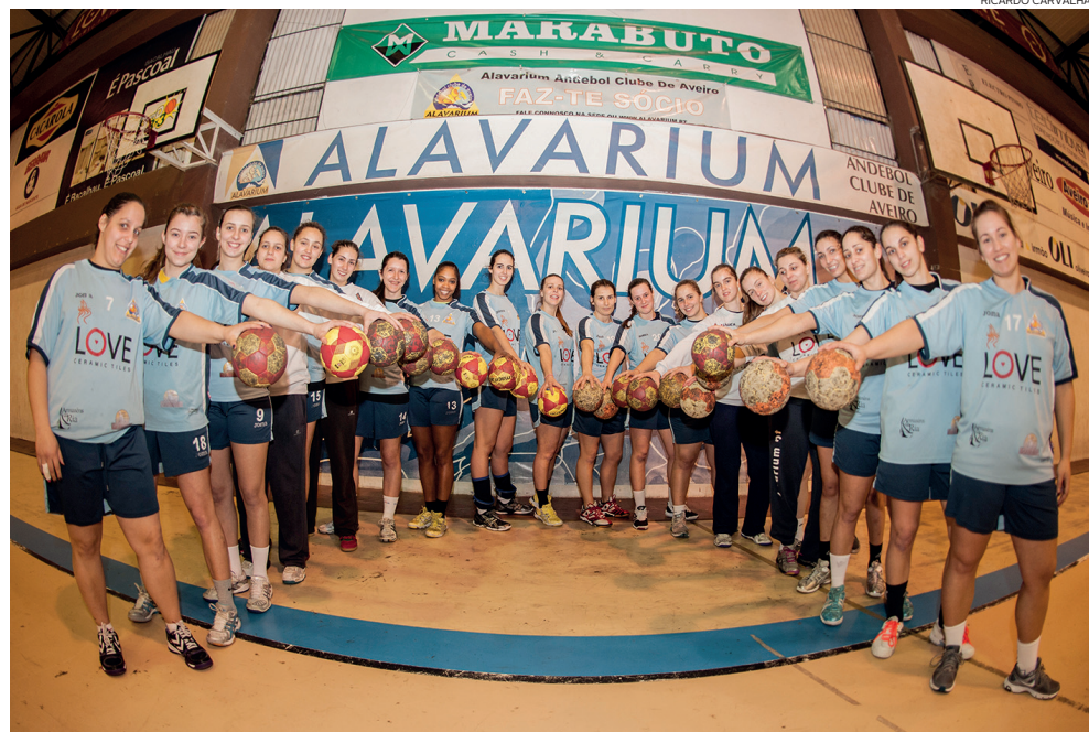
GRUPO DO ALAVARIUM está unido para a conquista do título nacional