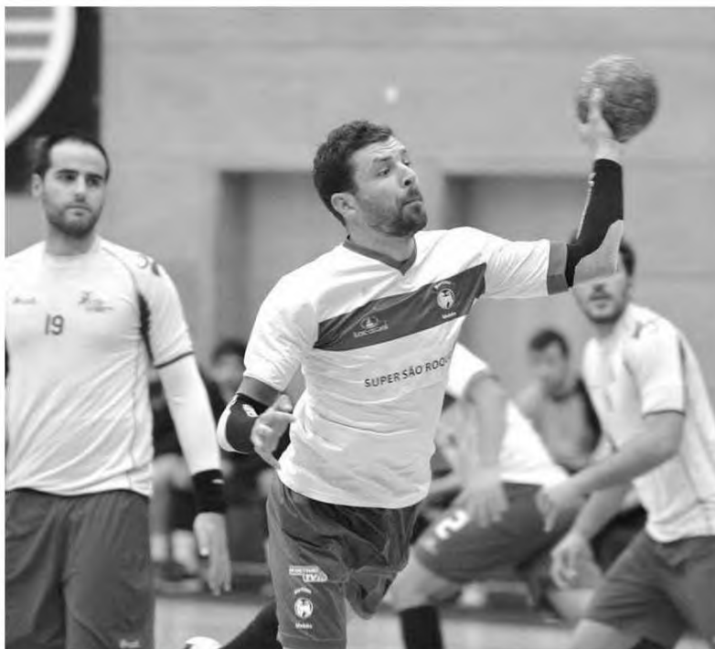
Verde-rubros foram confrontados com situação caricata.

De acordo com as regras do bom senso, o Marítimo pretendia ficar mais um dia no Continente, poupano assim uma viagem e energias, num esforço que custaria pouco mais de 500 euros pela estadia extra,