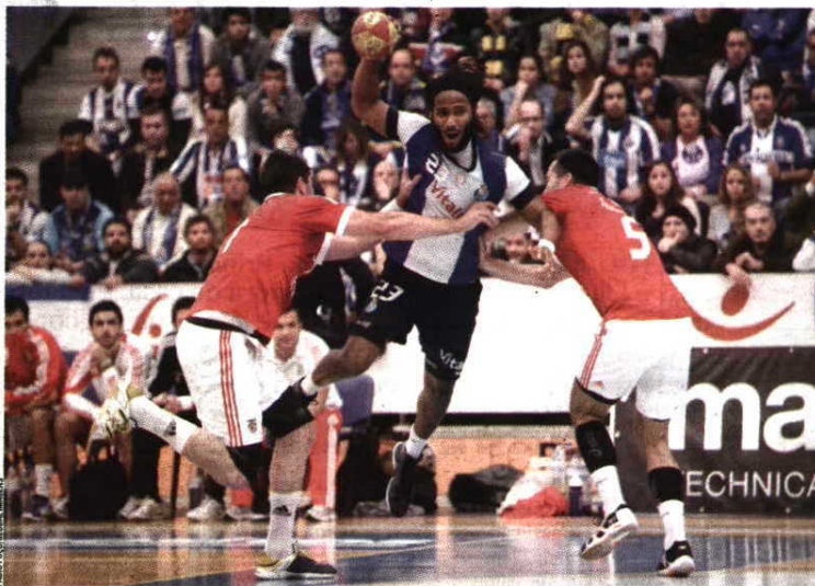
Há sete meses – Foi em maio a última vez que o FC Porto recebeu o Benfica