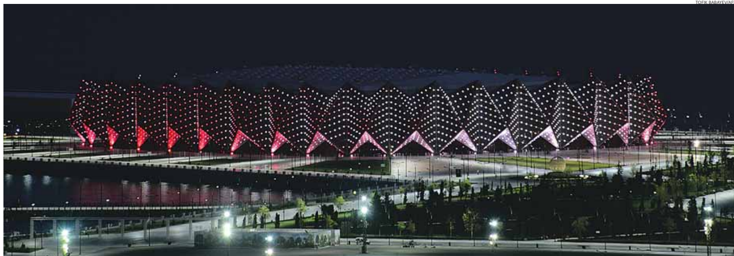
O Crystal Hall, pavilhão que vai receber as competições de andebol e de voleibol durante os Jogos Europeus

Falta um mês para o evento que vai reunir cerca de seis mil atletas em Baku, a capital de um país que está no fundo de muitas listas de liberdade de imprensa e respeito pelos direitos humanos