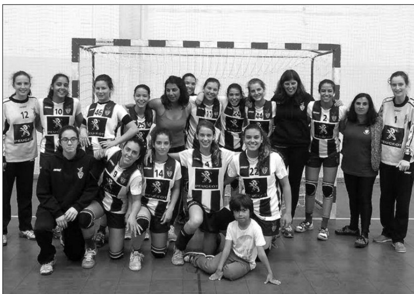
Equipa do Sports Madeira sagrou-se campeã regional de iniciados em andebol.

Conquistados os títulos regionais, as equipas do Madeira Andebol SAD e do Sports Madeira vão disputar as fases de apuramento dos Campeonatos Nacionais ainda durante o mês de maio.