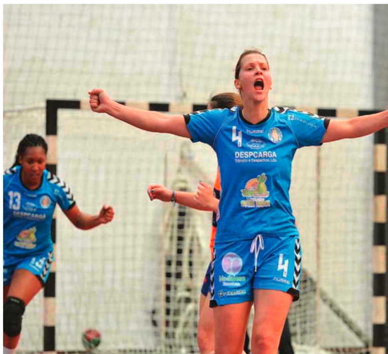
Madeira SAD ganhou ao Colégio João Barros por 28-26.