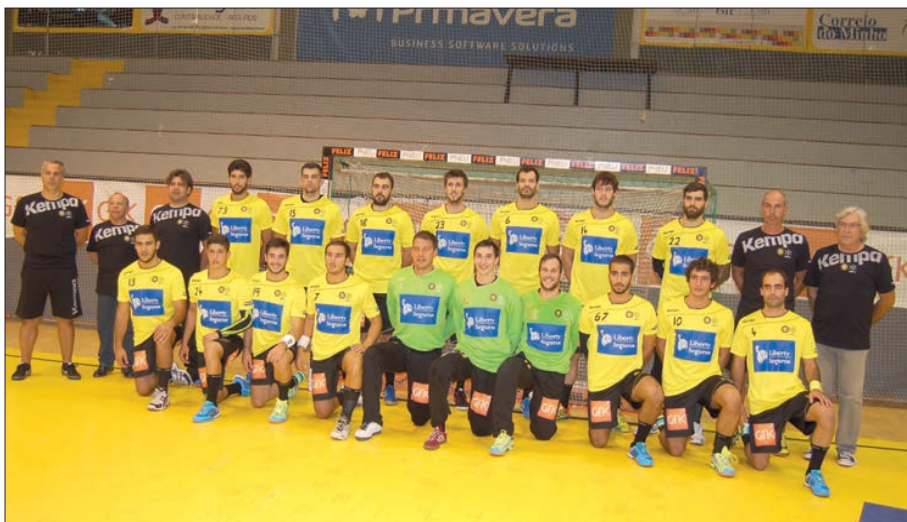
ABC/UMinho quer terminar o campeonato no terceiro lugar

ABC/UMinho joga hoje, às 19h00, no pavilhão número 2 da Luz, frente ao Benfica, no primeiro jogo do play-off de apuramento do terceiro e