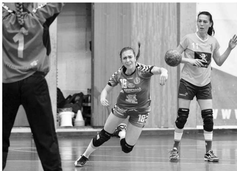
SAD tenta atingir um título que lhe foge à duas épocas.