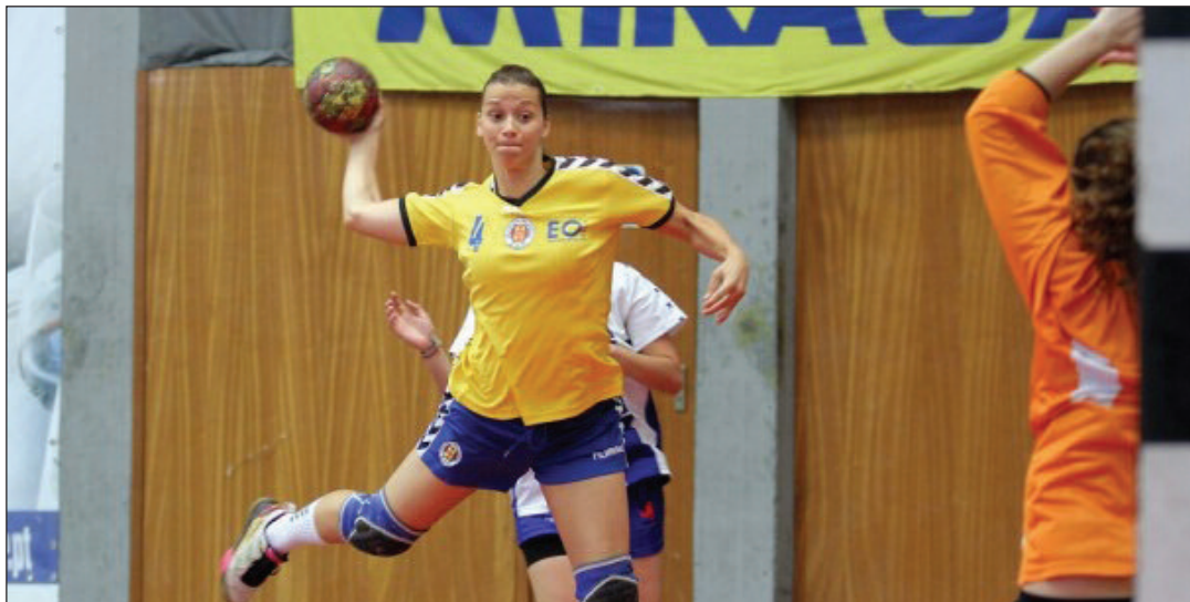
Madeira SAD venceu o Colégio João de Barros e ficou em vantagem para apurar-se para a final.

A equipa do Madeira SAD foi ontem à casa do Colégio João de Barros vencer por 28-26, com 15-13 ao intervalo favorável à equipa de Pombal, no primeiro jogo das meias-finais do "play-off" da I divisão de andebol feminino.