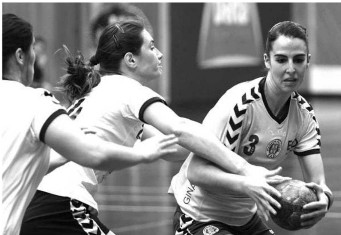
O Madeira Andebol venceu facilmente o Juventude de Lis.