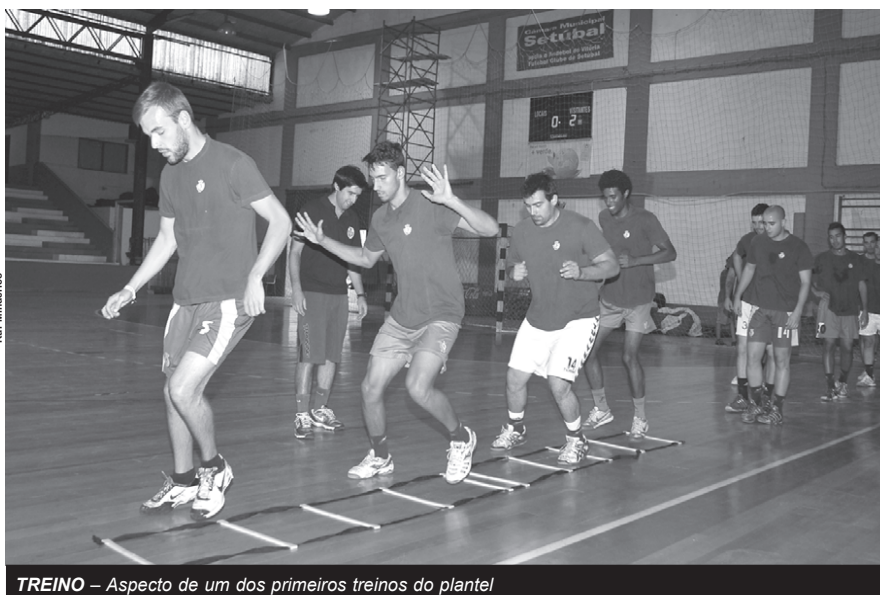
TREINO – Aspecto de um dos primeiros treinos do plantel