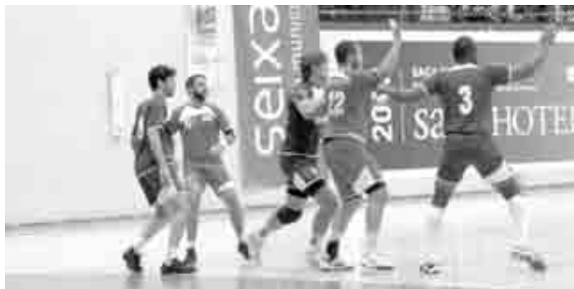
Ginásio do Sul não pode falhar nas duas últimas jornadas

O Ginásio do Sul, ao perder nos Açores, com o Marienses, por 24-19, em jogo a contar para a 16.ª jornada do Campeonato Nacional da 2.ª Divisão, complicou um pouco as contas relativas ao apuramento para o play-off dos primeiros, mas as suas aspirações mantêm-se intactas porque para conseguir o objectivo continua a depender apenas de si próprio. A duas jornadas do final da primeira fase e com os dois primeiros (Marítimo e Camões, praticamente já apurados) resta agora saber quem os irá acompanhar na passagem à fase seguinte da competição. Ginásio do Sul e Marienses estão iguais em termos pontuais mas os ginasistas estão em vantagem porque ganharam por sete golos de diferença na Co-va da Piedade e perderam por cinco nos Açores. Portanto, para conseguirem o que desejam, sem depender de ninguém, os ginasistas que recebem o Marítimo e se deslocam a Benavente precisam de vencer, em ambos os casos. A tarefa não se apresenta