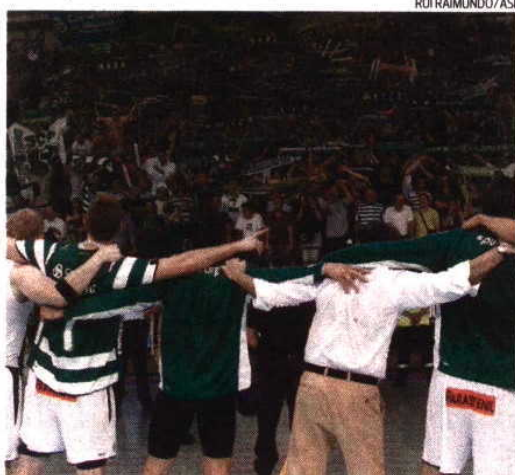
Milhares de sportinguistas festejaram conquista da Taça Challenge

História à vista, espera-se, para os três colossos!