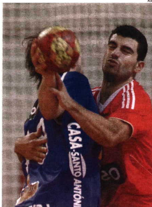
Benfica em excelente posição para igualar o feito de equipas portuguesas nos 'quartos' da Taça das Taças, protagonizado por dragões e leões

Um marco digno de registo obteve pelas 40 equipas (14 masculinas e 26 femininas) ao longo destes 54 anos, já com um troféu conquistado — o Sporting venceu a Taça Challenge em 2009/10 — e ainda mais três finais alcançadas: ABC e Sp. Horta nesta prova em 2004/05 e 2005/06,