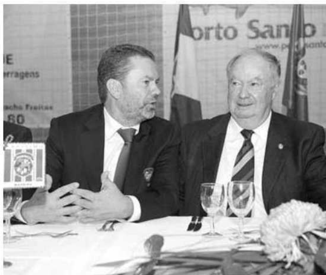
A participação do Governo nas SAD, sobretudo do Marítimo, está em causa.

FRANCISCO JOSÉ CARDOSO fcardoso@dnnoticias.pt