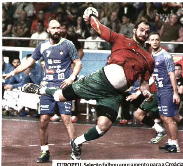
EUROPEU. Seleção falhou apuramento para a Croácia

A fase de qualificação para o Europeu'2018 ficou ontem fechada, sendo de destacar a luta titânica no Grupo 4, que repescou a Islândia. A seleção insular venceu (34-26) a Ucrânia e acabou com o melhor 3º lugar dos sete grupos, enquanto a Macedónia superou (33-20) a República Checa, com ambas os conjuntos a qualificarem-se. O sorteio do Europeu'2018 será sexta-feira, com os 16 países: Croácia (organizador), Alemanha, Dinamarca, Espanha, França, Macedónia, Bielorrússia, Suécia, Hungria, Sérvia, Eslovénia, Noruega, Montenegro, Áustria, Rep. Checa e Islândia. A.R.