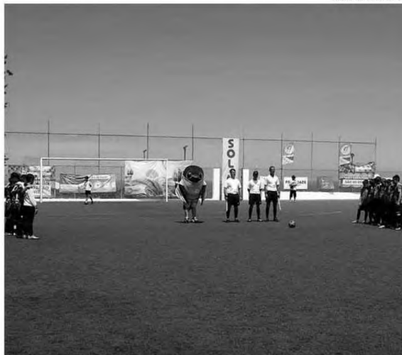
No Nordeste foi cumprido um minuto de silêncio em honra das vítimas do incêndio