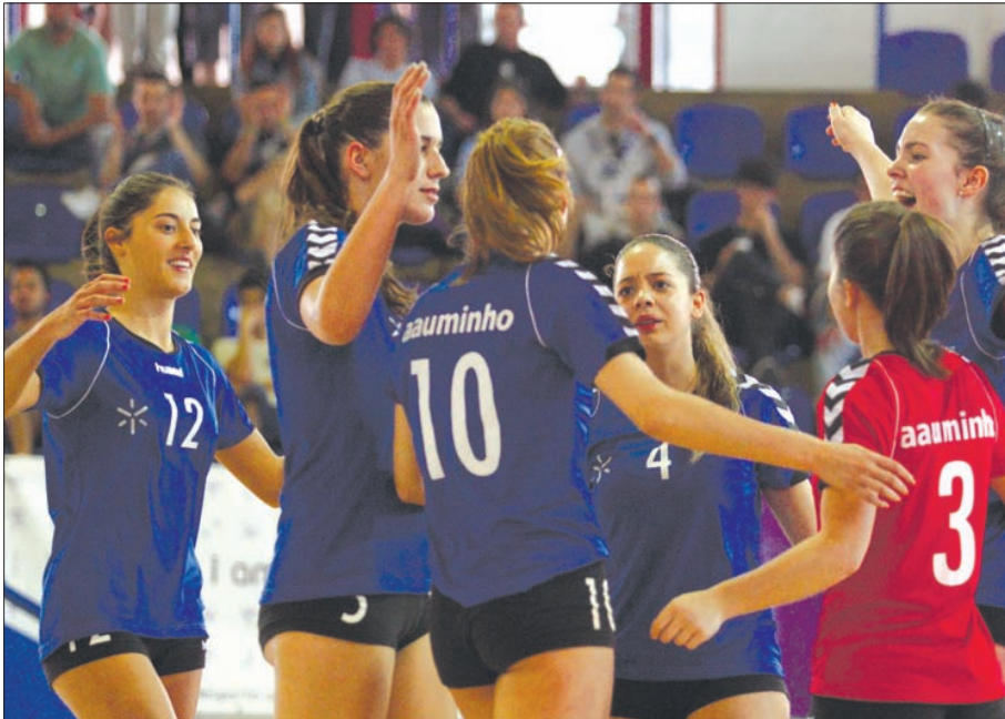
Voleibol feminino em ação

As equipas da UMinho que estão a disputar os europeus (andebol masculino, futebol 11 masculino e voleibol feminino) terminaram a primeira fase dos seus campeonatos e vão agora lutar pela passagem às meias-finais da prova. Se para o andebol a tarefa se avizinha fácil, já para o futebol e volei-