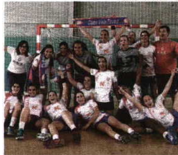
Equipa fez história no clube de Tavira