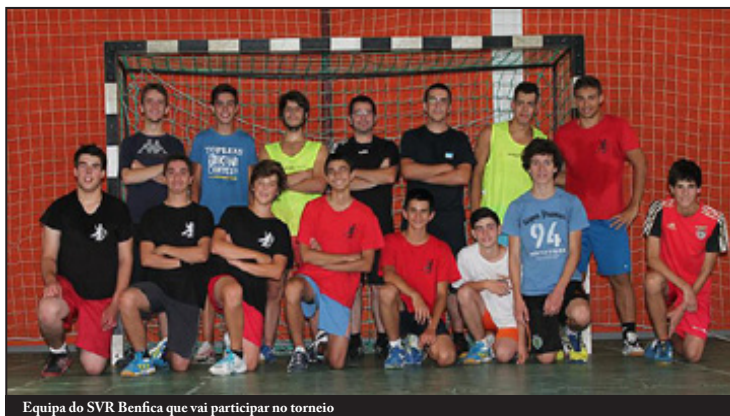
Equipa do SVR Benfica que vai participar no torneio

"Sobretudo ao nível dos escalões de formação é necessário conseguir mais apoios, é preciso mudar mentalidades junto do município e das