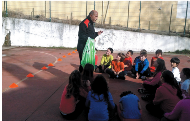
Alunos do Figueira Mar estão a começar a praticar andebol

FESTA “Andebol4Kids” é a designação da festa do andebol, que vai decorrer no dia 10, durante a manhã, na Escola Infante D. Pedro em Buarcos, para os alunos do 1.º ciclo das quatro escolas do Agrupamento Figueira Mar. Uma iniciativa organizada pela Câmara Municipal, aquele agrupamento, a Federação de Andebol de Portugal e que engloba ainda a assinatura de um protocolo entre estes organismos e também com o Grupo Caras Direitas de Buarcos e que visa a promoção desta modalidade desportiva junto dos meninos das escolas do Serrado, Castelo, Infante D. Pe-