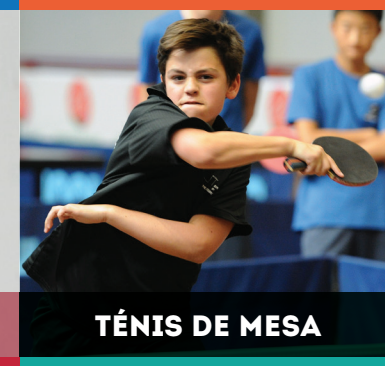
TÉNIS DE MESA