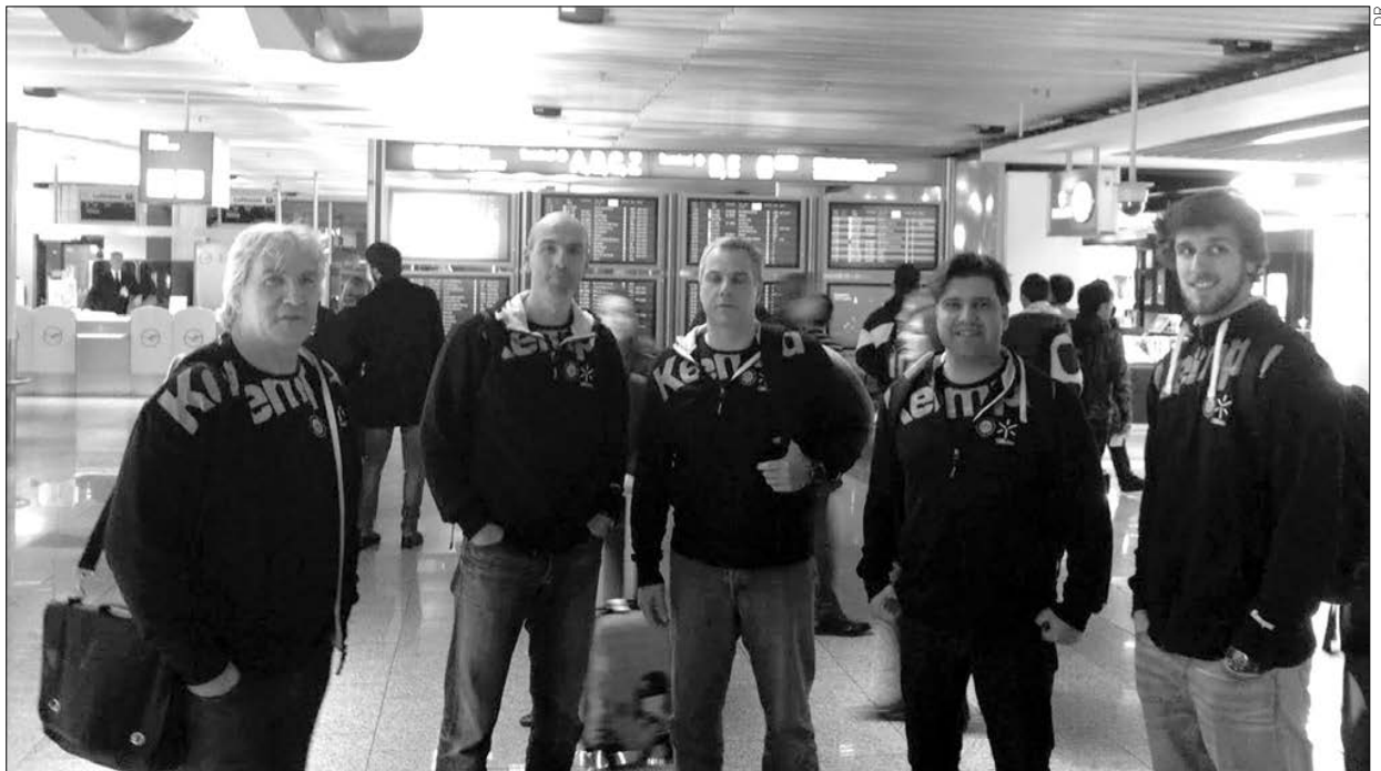
Comitiva do ABC fez uma escala de cinco horas em Frankfurt

A equipa do ABC/UMinho chegou ontem a Odorhei, na Roménia, já de madrugada, depois de um dia intenso que começou de manhã e terminou passadas quase 15 horas. Amanhã, recorde-se, a formação bracrense defronta o adversário romeno em partida da primeira mão da terceira ronda da Taça Challenge, numa reedição da final da temporada passada, desfavorável aos portugueses.