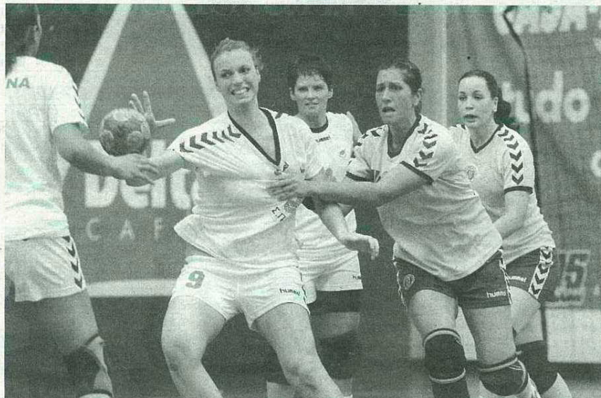
SAD feminina joga em Novembro para as competições europeias e 'cede' logo a seguir atletas para a selecção.