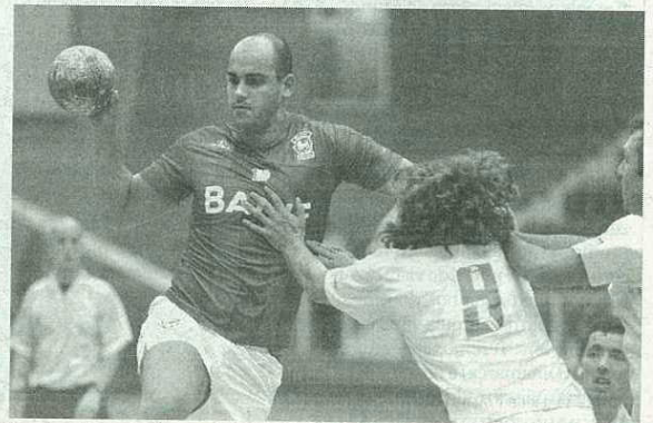
Verde-rubros conhecem hoje adversário dos 16 avos da Taça de Portugal.

De referir que os oitavos de final daquela que é a segunda prova mais importante da competição nacional organizada pela FAP, onde os verde-rubros estão na corrida, contará já com as formações que disputam o Nacional da I Divisão, nomeadamente o Madeira andebol SAD, ABC, Águas Santas, São Mamede, Xico Andebol, Belenenses, FC Porto, São Bernardo, Colégio 7 Fontes, Benfica, Sp. Horta e Sporting.