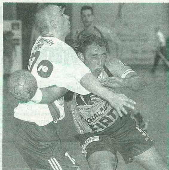
Equipa de Paulo Fidalgo está de regresso à Taça EHF a 20 de Novembro.

HERBERTO DUARTE PEREIRA desporto@dnnoticias.pt