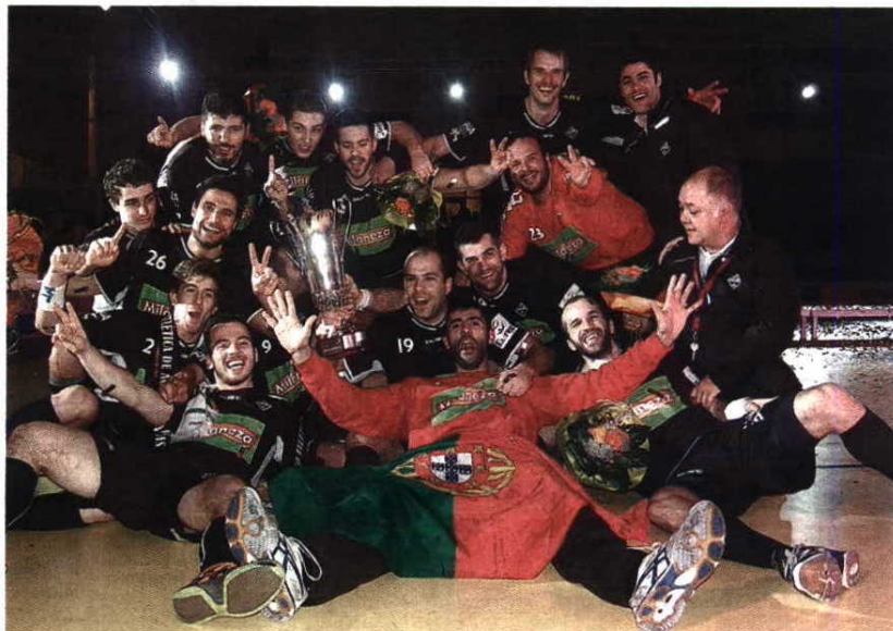
Delírio Águas Santas festejou na Holanda o primeiro êxito internacional da sua história