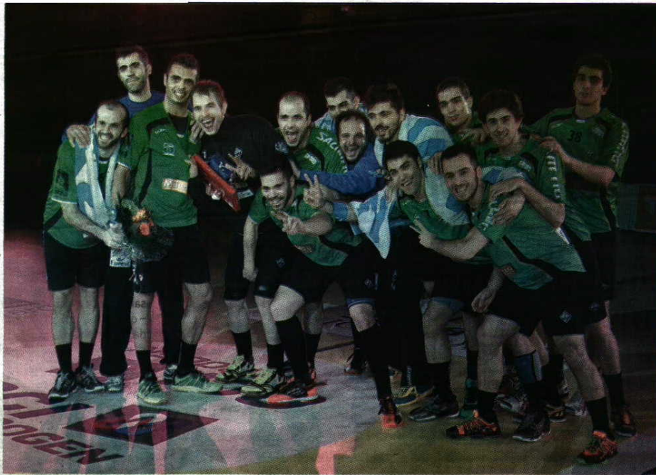
Orgulho - Águas Santas fez pela primeira vez quatro jogos em dois dias e melhorou em todos eles. Agora é favorito