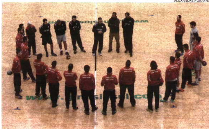
A Seleção Nacional masculina estagiou em Almada no fim de semana e hoje rumo à Estónia