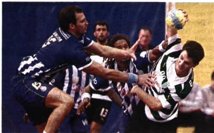
RIVALS. FC Porto e Sporting dividiram o protagonismo

Com um aumento do investimento, em contraciclo com os rivais, os dragões alcançaram outro feito inédito, ao qualificarem-se para a fase de grupos da Liga dos Campeões, virando o ano com duas vitórias.