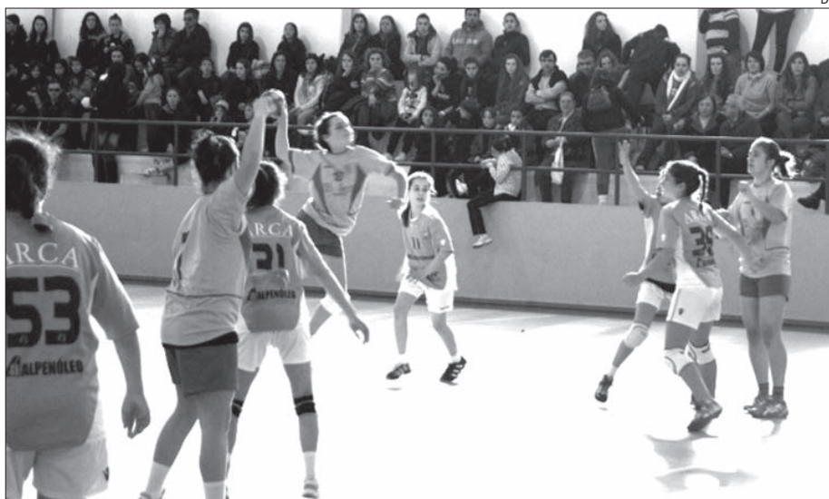
Um pormenor de um dos encontros disputados

O evento, cujos jogos decorreram nos pavilhões gímnodesportivos do Centro Social da Juventude de Mar e da Escola EB 2,3 António Correia de Oliveira, de Esposende, constituiu mais uma gran-