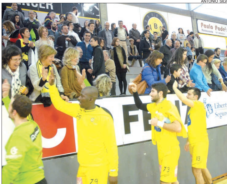
Jogadores do ABC/UMinho agradeceram presença do público