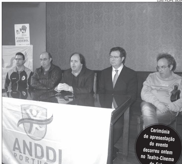
Mesa que ontem apresentou a competição em Fafe