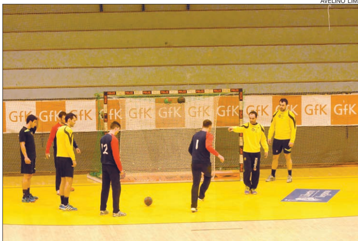
Andebolistas começaram o treino a jogar... futsal