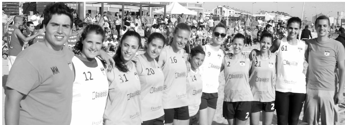
No final só havia motivos para sorrir

Depois de no primeiro jogo ter havido necessidade de recorrer ao método de contra-ataques para apurar as vencedoras, as 'Últimas a Sair' não voltaram a vacilar vencendo os restantes quatro jogos com toda a justiça e a apresentar um andebol de grande categoria. "Esta etapa está a correr como nós prevíamos e chegamos à final apenas com vitórias, apesar de no primeiro jogo termos claudicado um pouco, mas as atletas res-