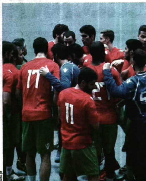
Seleção universitária festeja medalha de ouro

A equipa composta por alguns jogadores que atuam em clubes da I Divisão (FC Porto, ABC, ISMAI ou Xico Andebol) e que já conseguiram a proeza de no ano passado se sagrarem campeões mundiais pela primeira vez, triunfaram por 25-21, terminando a campanha sem qualquer derrota. A equipa das Quinas nem entrou bem no desafio (desvantagem de 0-3), mas reequilibró as contas para ao intervalo se registar um empate a 11. No recomeço, um parcial de cinco golos sem resposta foi vi-