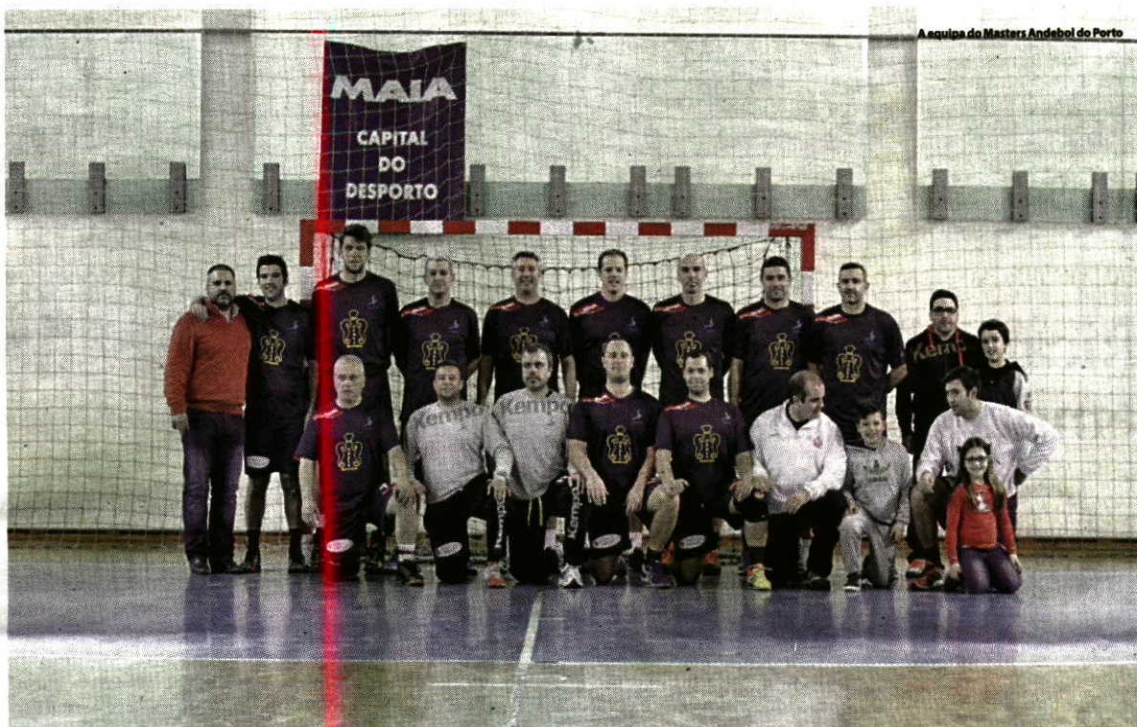
A equipa do Masters Andebol do Porto