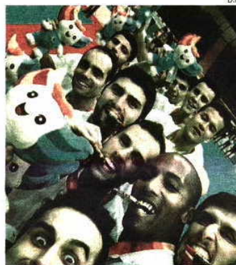
Seleção confirmou favoritismo

A Seleção universitária de andebol juntou ontem o título das Universiadas ao Mundial ganho no ano passado, conquistando para Portugal a primeira medalha numa modalidade coletiva de sempre, nas Universiadas a decorrer em Gwangju, Coreia do Sul. Favorita, dada a qualidade do plantel, a Seleção demonstrou ser superior às restantes equipas no torneio, que venceu ao bater a Sérvia na final, por 25-21. Após o empate a 11 ao intervalo, Portugal disparou no marcador com parcial de 5-0. Mais tarde ampliou a diferença para 19-