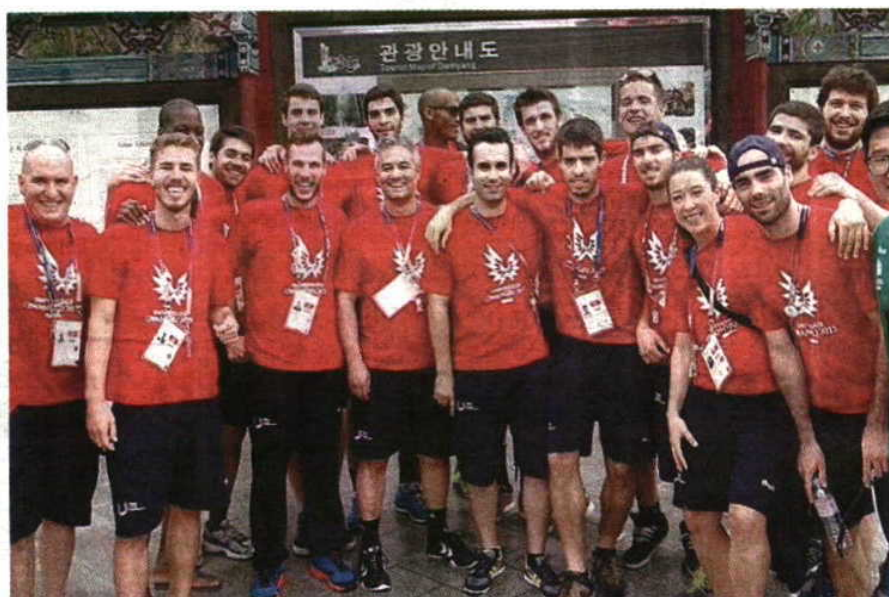
A seleção portuguesa de andebol fechou com chave de ouro a participação lusa nas Universíadas

► Seis jogos, seis vitórias, medalha de ouro e novo momento histórico para o desporto português, mais um protagonizado pela seleção universitária de andebol. Quase um ano depois da conquista do título mundial na categoria, o conjunto comandado por Rolando Freitas voltou a fazer a festa, desta feita em Gwangju, na Coreia do Sul, onde termina, hoje, a 28.ª edição das Universíadas de Verão. Na final do torneio, a Sérvia sucumbiu ao poderio português na etapa complementar: 25-21 foi o resultado.