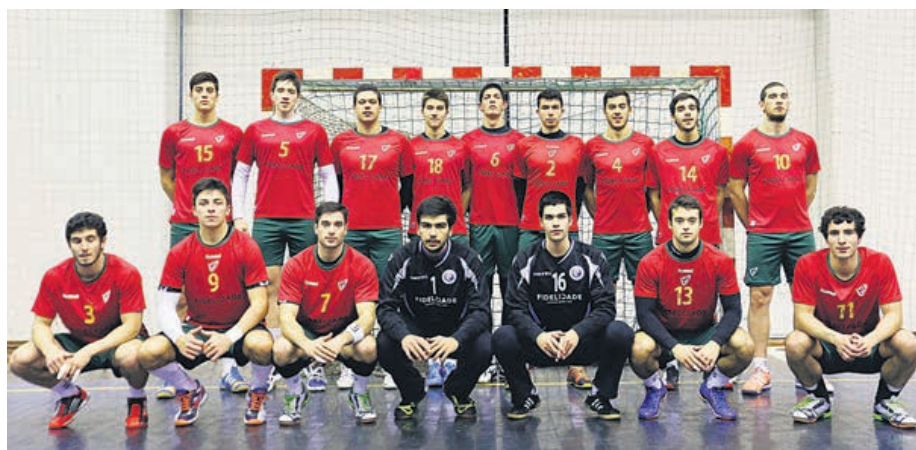
Seleção nacional de andebol sub-21 fez preparação em Guimarães antes dos dois jogos amigáveis em Espanha

COM TRÊS MINHOTOS , dois do ABC/UMinho e um do Xico Andebol, a selecção nacional de andebol de sub-21, que nunca ganhou à Espanha em jogos oficiais, venceu a congénere espanhola em León.