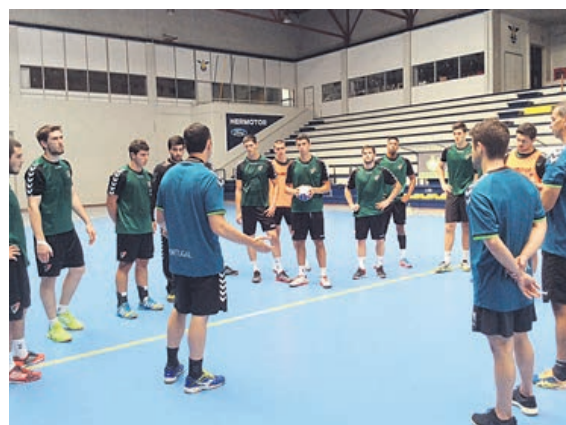
Seleccionador Luís Monteiro com a equipa nacional em Guimarães

Em relação à maneira como a equipa jogou, o seleccionador nacional confessa que "fizemos um jogo muito bom na defesa, e no ataque conseguimos encontrar sempre soluções para defrontar as diferentes defesas que a Espanha teve de utilizar para tentar 'encostar-se' ao jogo. A meio da segunda parte, a perder por três golos, a Espanha tentou tudo. Mostrámos muita maturidade e vontade no jogo e conseguimos sempre ultrapassar essas dificuldades que a Espanha nos tentou criar", refere ainda Luís Monteiro.