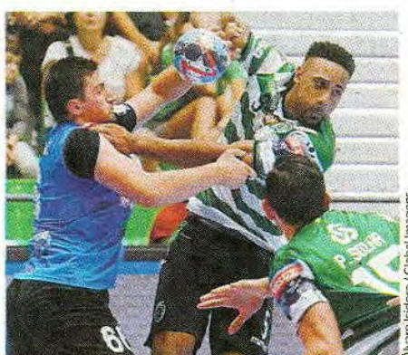
Alvaro Isidoro / Global Images