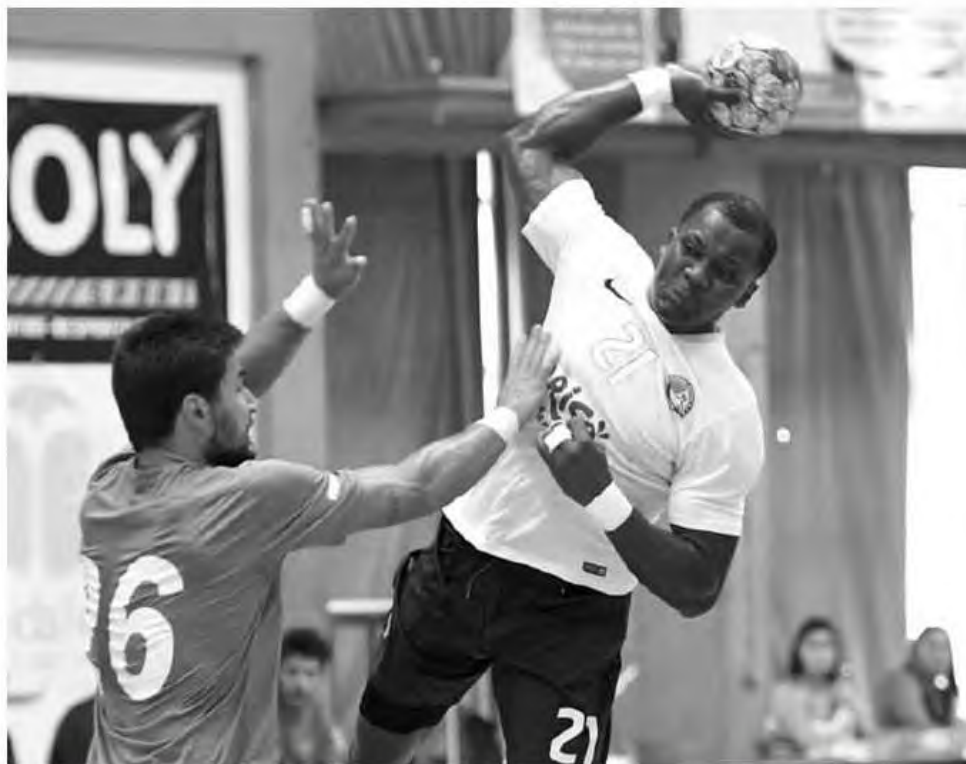
O Madeira SAD vai tentar repetir a vitória obtida sobre o Belenenses.